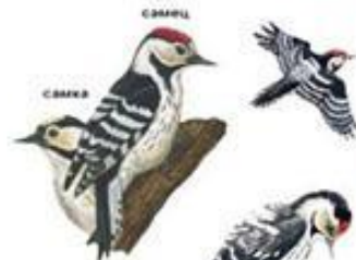
Малый пестрый дятел