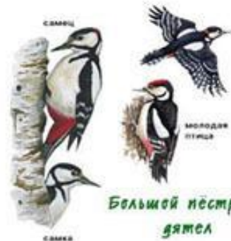
Большой пестрый дятел