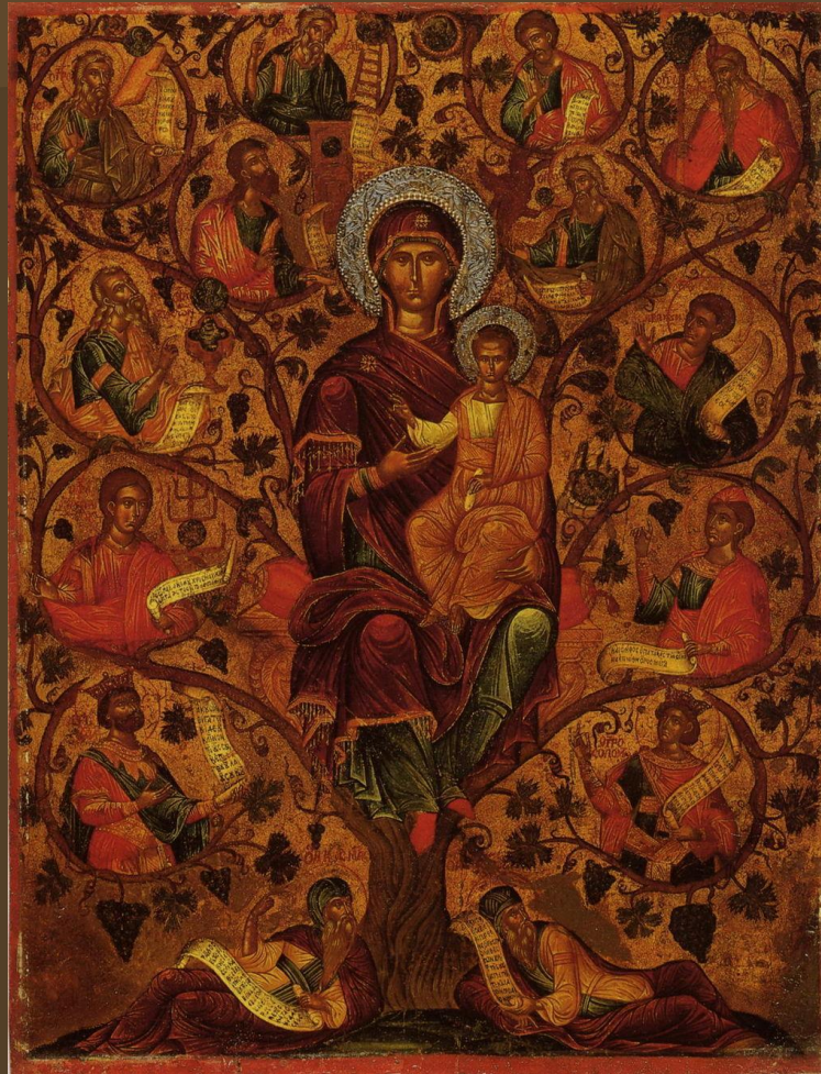
Дерево, темпера, позолота, чеканка