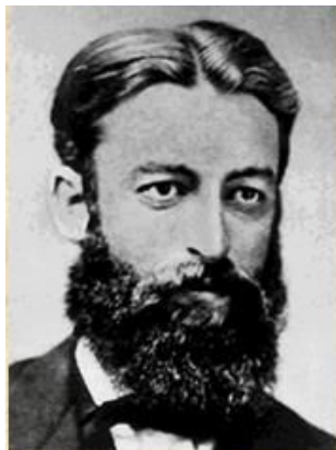
ТАБЛИЦА МЕЙЕРА 1864

Юлиус Лотар Мейер – немецкий химик. Наряду с Менделеевым считается создателем Периодической системы