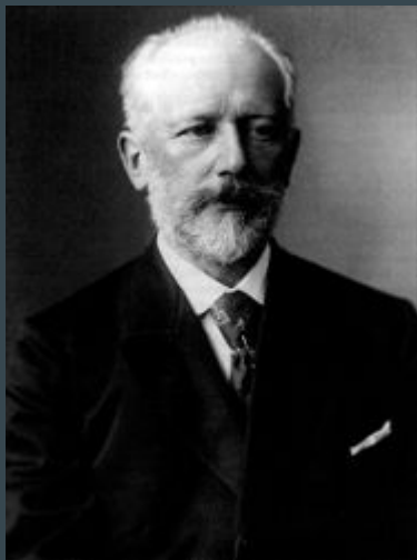
Чайковский Пётр Ильич.