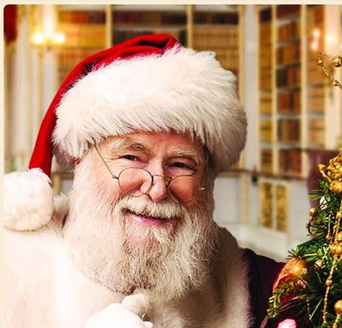
«Фазер Кристмас» (Father Christmas)