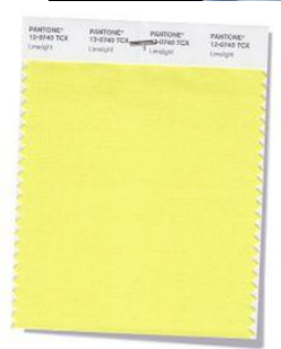
PANTONE 12-0740 Limelight Animated and effervescent, a pungent yellow-green becomes the center of