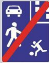
5.22 Конец жилой зоны