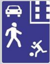
5.21 Жилая зона