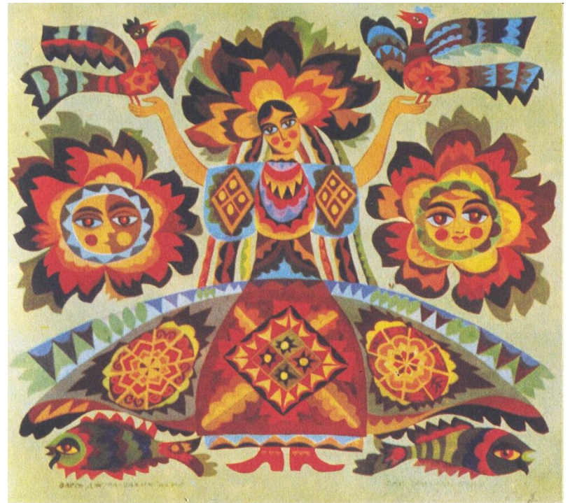
Пажимський О. Ой весна, весна. Панно. Картон, гуаш. с. Салочки Хмельницької обл. 1986.

Малые жанры фольклора — это небольшие по размеру фольклорные произведения.