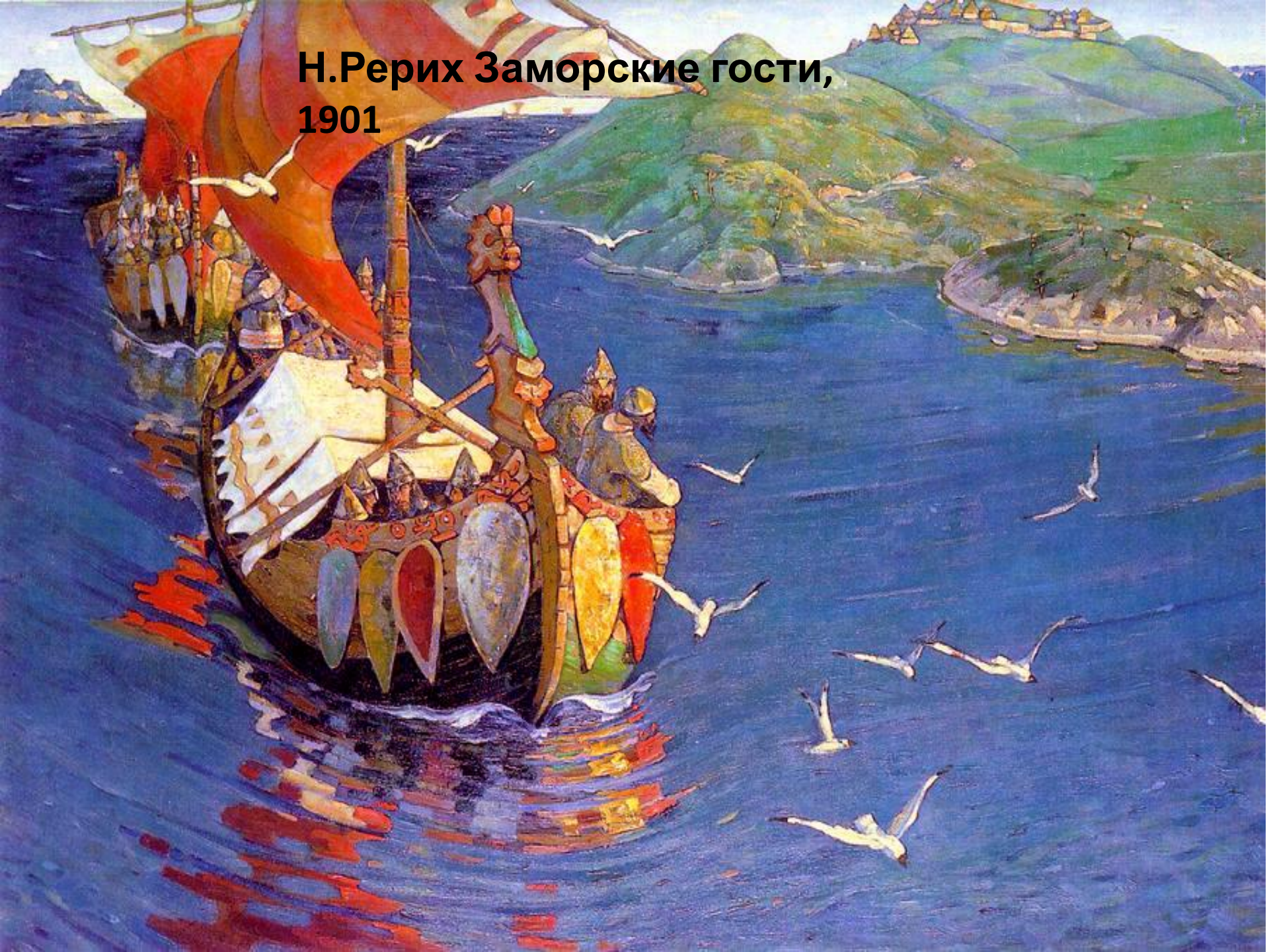
Н.Рерих Заморские гости, 1901