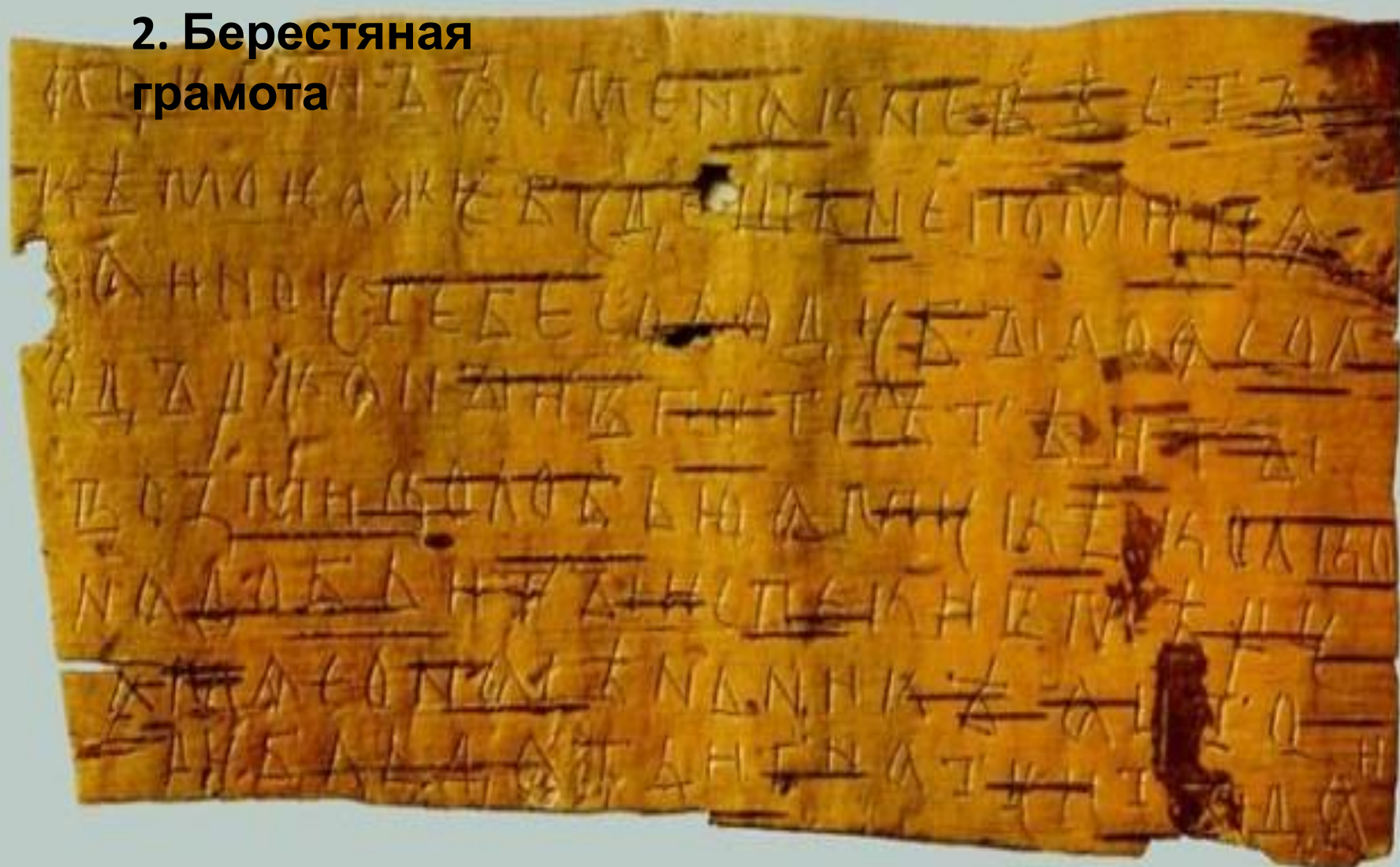
Грамота № 363. Конец XIV в. Письмо Семёна известке с хозяйственными распоряжениями. Размер 16,4 × 8 см.