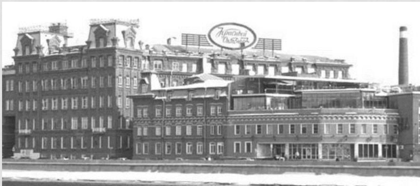
14. Креативный кластер на территории завода «Красный октябрь» г. Москва