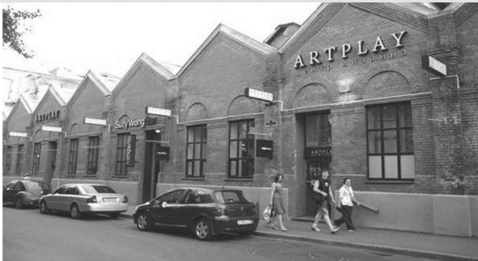
Рис. 15. Центр дизайна. торгово-выставочный комплекс «Artplay» в