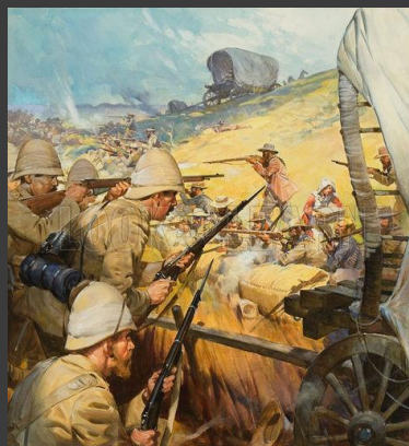
Англо-бурская война 1899 - 1902