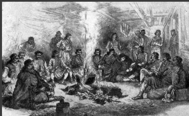
Освободительная борьба Балканских народов