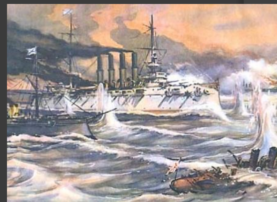
Русско-японская война 1904-1905