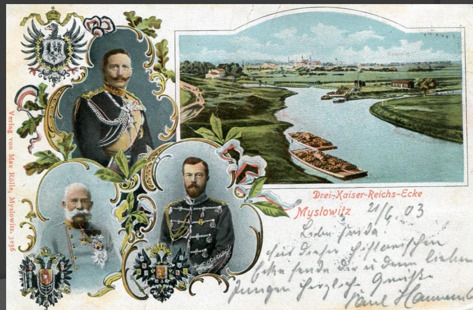
Союз Трех императоров.