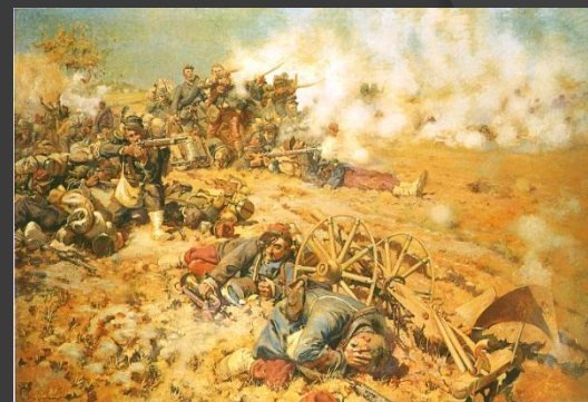
Франко-прусская война 1870-1871.