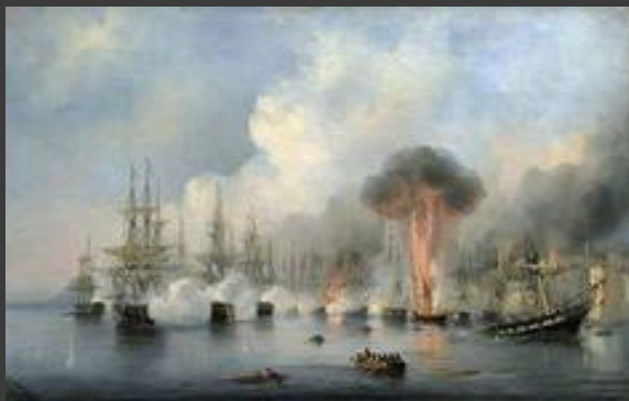
Крымская война 1853-1856.