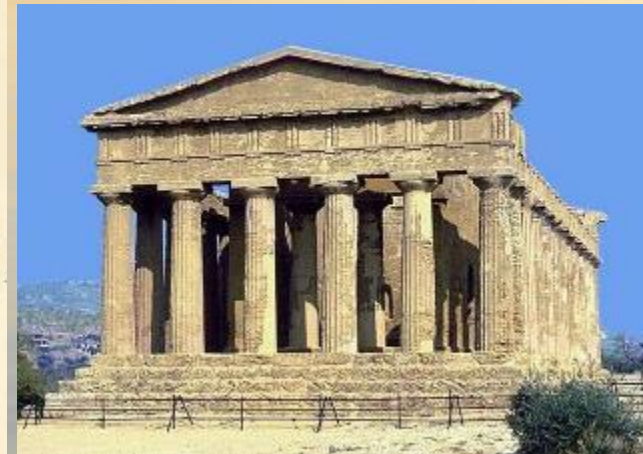
Храм Деметры, VI век до н.э. Олимпия