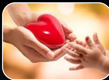
Любовь к детям