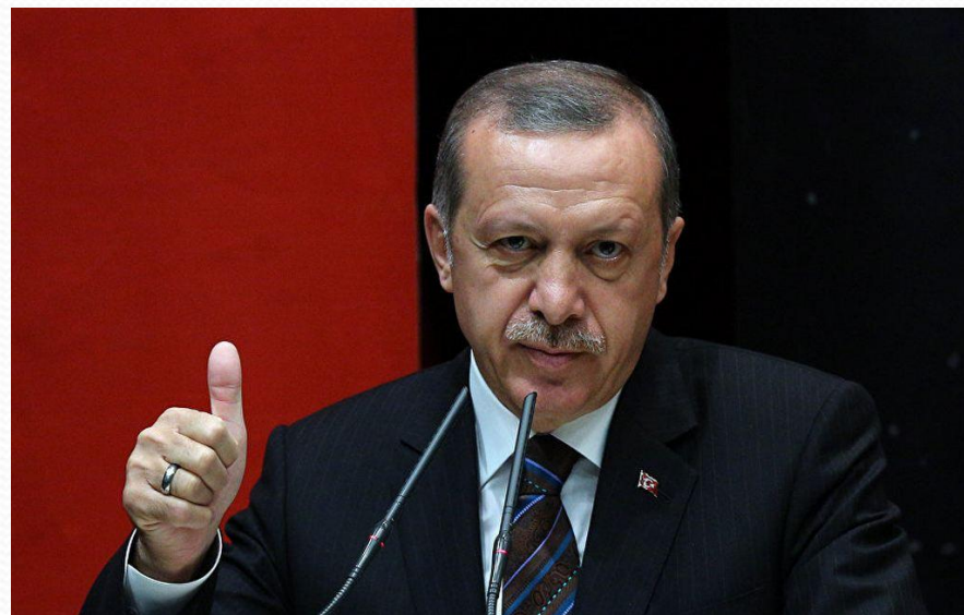
Реджеп Тайип Эрдоган