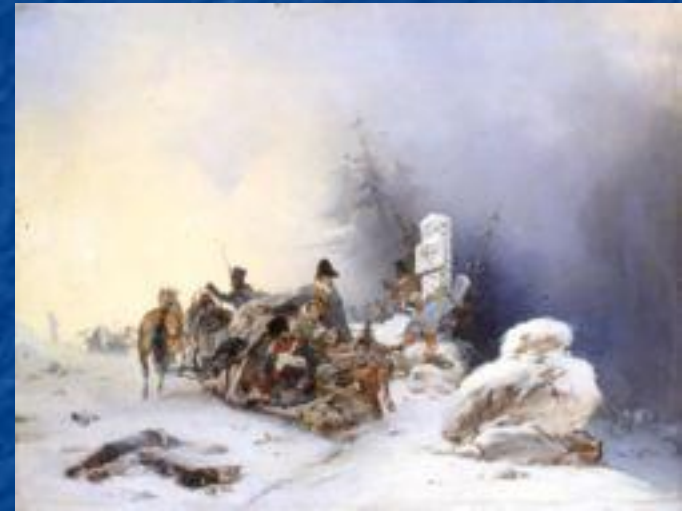
Бегство французов с семьями из России.

14 декабря в Ковно жалкие остатки «Великой Армии» в количестве 1600 человек переправились через Неман в Польшу, а затем в Пруссию. Позднее к ним присоединились остатки войск с других направлений. Отечественная война 1812 года завершилась практически полным уничтожением вторгнувшейся «Великой Армии».