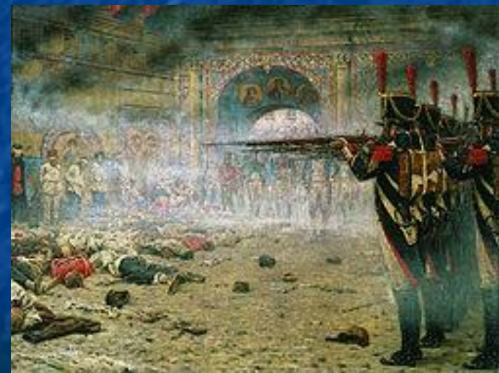
Расстрел предполагаемых поджигателей Москвы французами.