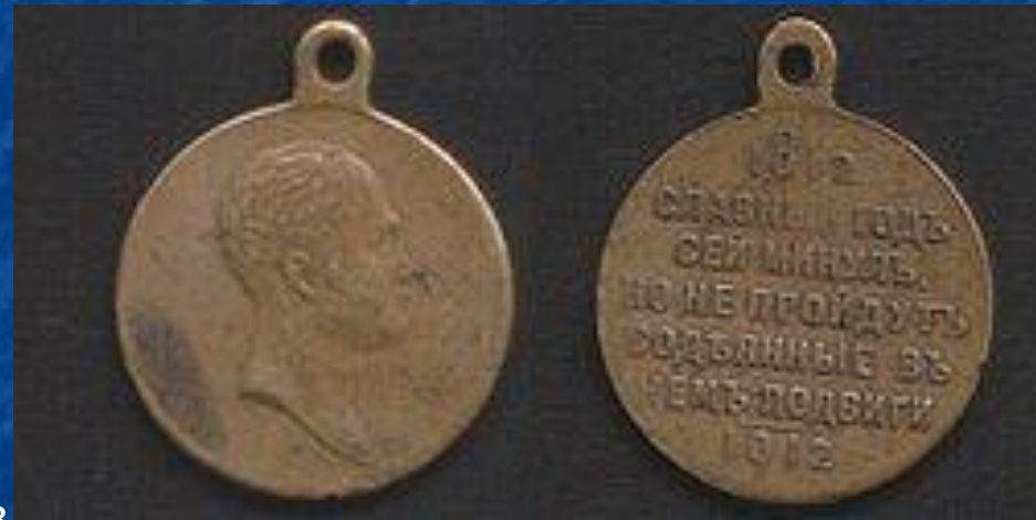
Наградная медаль в честь 100-летия победы в Отечественной войне 1812 года. Надпись: «Славный год сей минул, но не пройдут содеянные в нём подвиги»

■ Александровская колонна — менгир, один из известнейших памятников Петербурга. Воздвигнут в стиле ампир в 1834 году в центре Дворцовой площади архитектором Монферраном по указу Николая I в память о победе над Наполеоном.