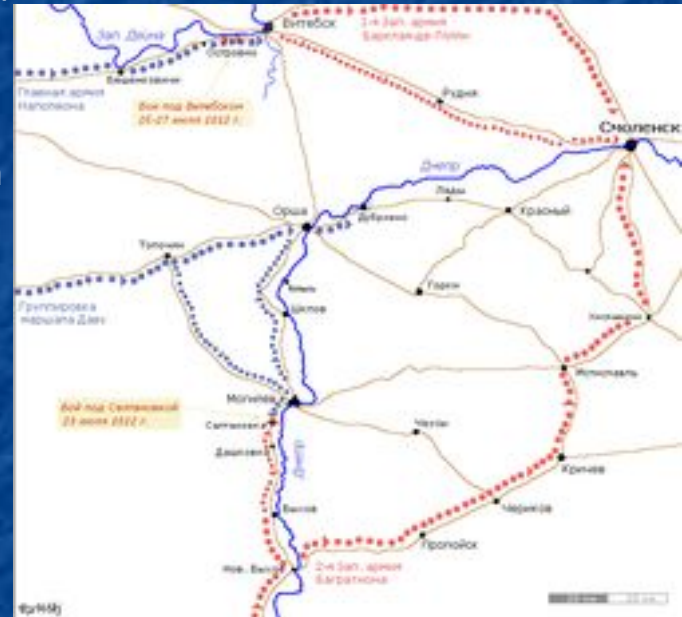
Схема соединения русских армий под Смоленском в начале августа 1812 года.

3 августа русские 1-я и 2-я армии соединились под Смоленском, достигнув таким образом первого стратегического успеха. В войне наступила небольшая передышка, обе стороны приводили в порядок войска, утомленные непрерывными маршами.