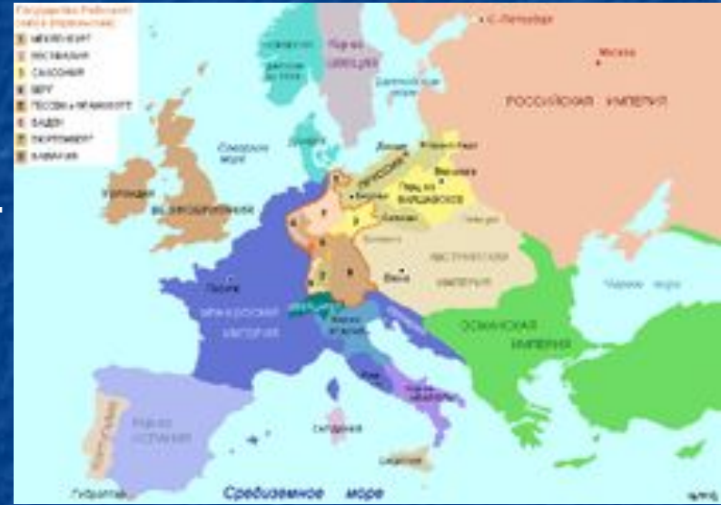
Карта Европы в 1812 году

С самого начала российская сторона планировала длительное организованное отступление с тем, чтобы избежать риска решительного сражения и возможной потери армии. Император Александр I сказал послу Франции в России Арману Коленкуру в частной беседе в мае 1811 года: «Если император Наполеон начнет против меня войну, то возможно и даже вероятно, что он нас побьет, если мы примем сражение, но это ещё не даст ему мира. Испанцы неоднократно были побиты, но они не были ни побеждены, ни покорены. А между тем они не так далеки от Парижа, как мы: у них нет ни нашего климата, ни наших ресурсов. Мы не пойдем на риск. За нас — необъятное пространство, и мы сохраним хорошо организованную армию. [...] Если жребий оружия решит дело против меня, то я скорее отступлю на Камчатку, чем уступлю свои губернии и подпишу в своей столице договоры, которые являются только передышкой. Француз храбр, но долгие лишения и плохой климат утомляют и обескураживают его. За нас будут воевать наш климат и наша зима.»