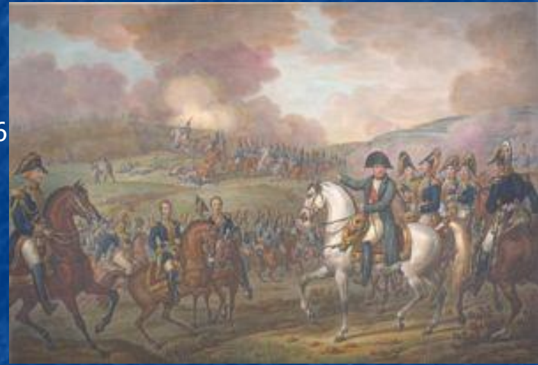
Наполеон в окружении генералов руководит Бородинским сражением. Рисунок из книги XIX в.

Отношения между Багратионом и Барклаем после выхода из Смоленска с каждым днем отступления становились всё напряжённее. 29 августа Кутузов в Царёво-Займище принял армию. В этот день французы вошли в Вязьму.