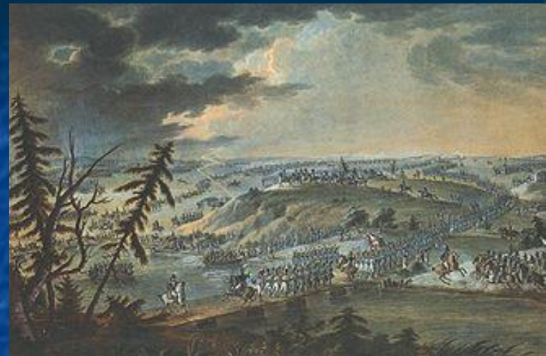
Переправа наполеоновской армии через Неман.

Император Александр I узнал о начале вторжения поздно вечером 24 июня в Вильно (совр. Вильнюс в Литве). А уже 28 июня в Вильно вошли французы. Только 16 июля Наполеон, устроив государственные дела в оккупированной Литве, покинул город вслед за своими войсками.