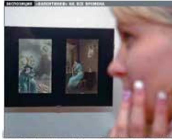
ИТАКИШВИЛИ ШКОЛЬНИКИ ПОМОГЛИ МИЛИЦИИ В РОЗЫСКЕ ПРЕСТУПНИКА

Ученики школы № 78 Калининского района помогли милиции в розыске преступника. Семерых десятиклассников школы наградили грамотами за помощь в розыске преступника. Ученики школы № 78 Калининского района помогли милиции в розыске преступника. Семерых десятиклассников школы наградили грамотами за помощь в розыске преступника.