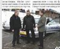
Внешний вид водителя такси — это отражение облика предприятия.

Облик водителя такси — это отражение облика предприятия. Внешний вид таксиста должен соответствовать уровню сервиса, который предоставляет компания. Клиенты должны видеть в таксисте профессионала, который заботится о своем имидже и о комфорте пассажиров. Внешний вид водителя — это визитная карточка предприятия. Он должен быть опрятным, чистым и доброжелательным. Хороший внешний вид таксиста повышает доверие клиентов к компании и способствует увеличению заказов. Компании должны уделять внимание обучению водителей не только в области вождения, но и в области этикета и внешнего вида. Это поможет им предоставлять клиентам высокий уровень сервиса и поддерживать репутацию предприятия.