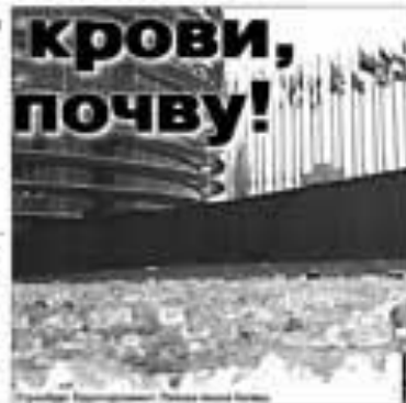
Строительная площадка в Барнауле