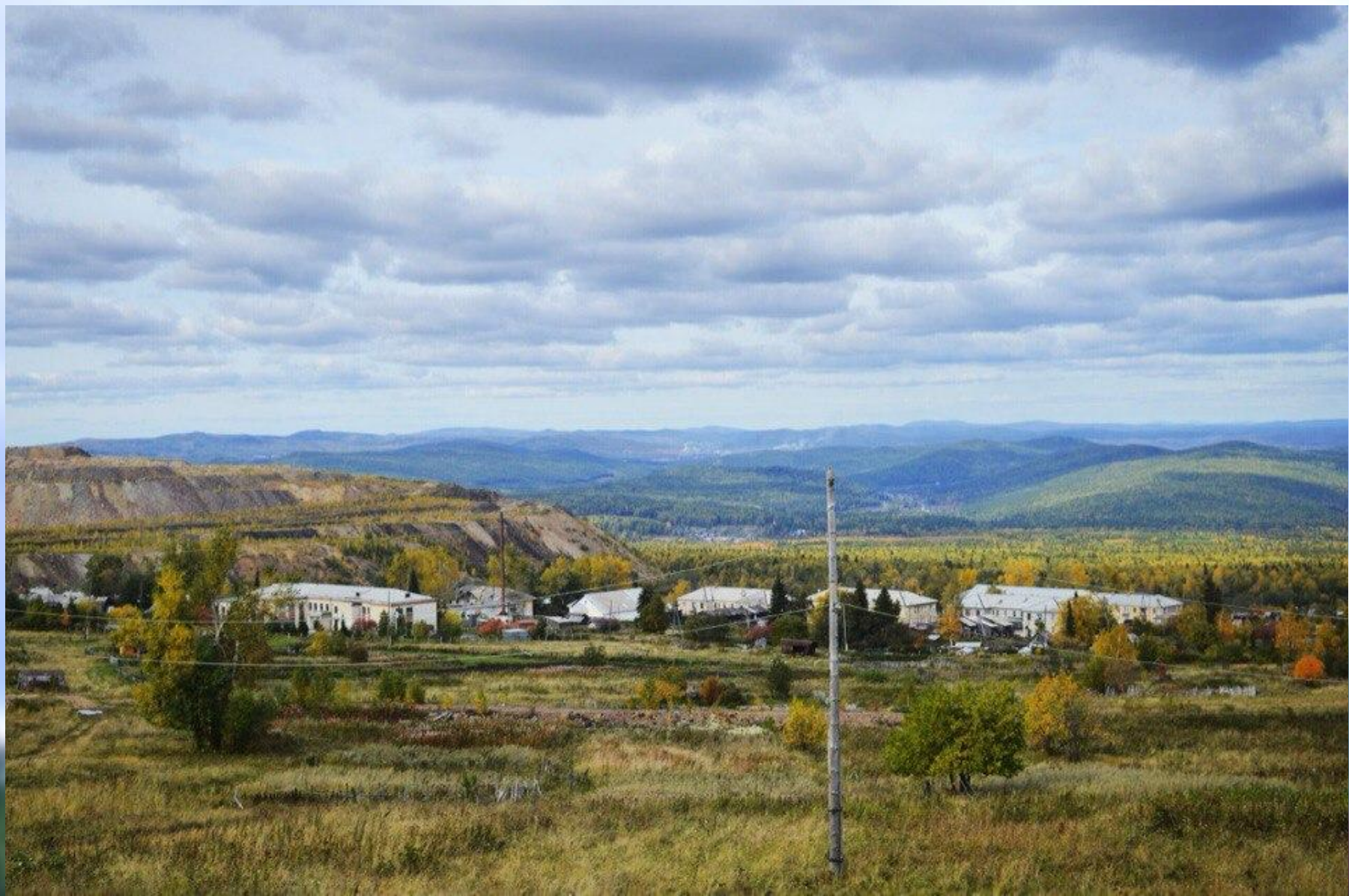
Поселок Иркутскан, вдали виднеется г. Сатка