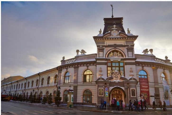
Национальный музей Республики Татарстан