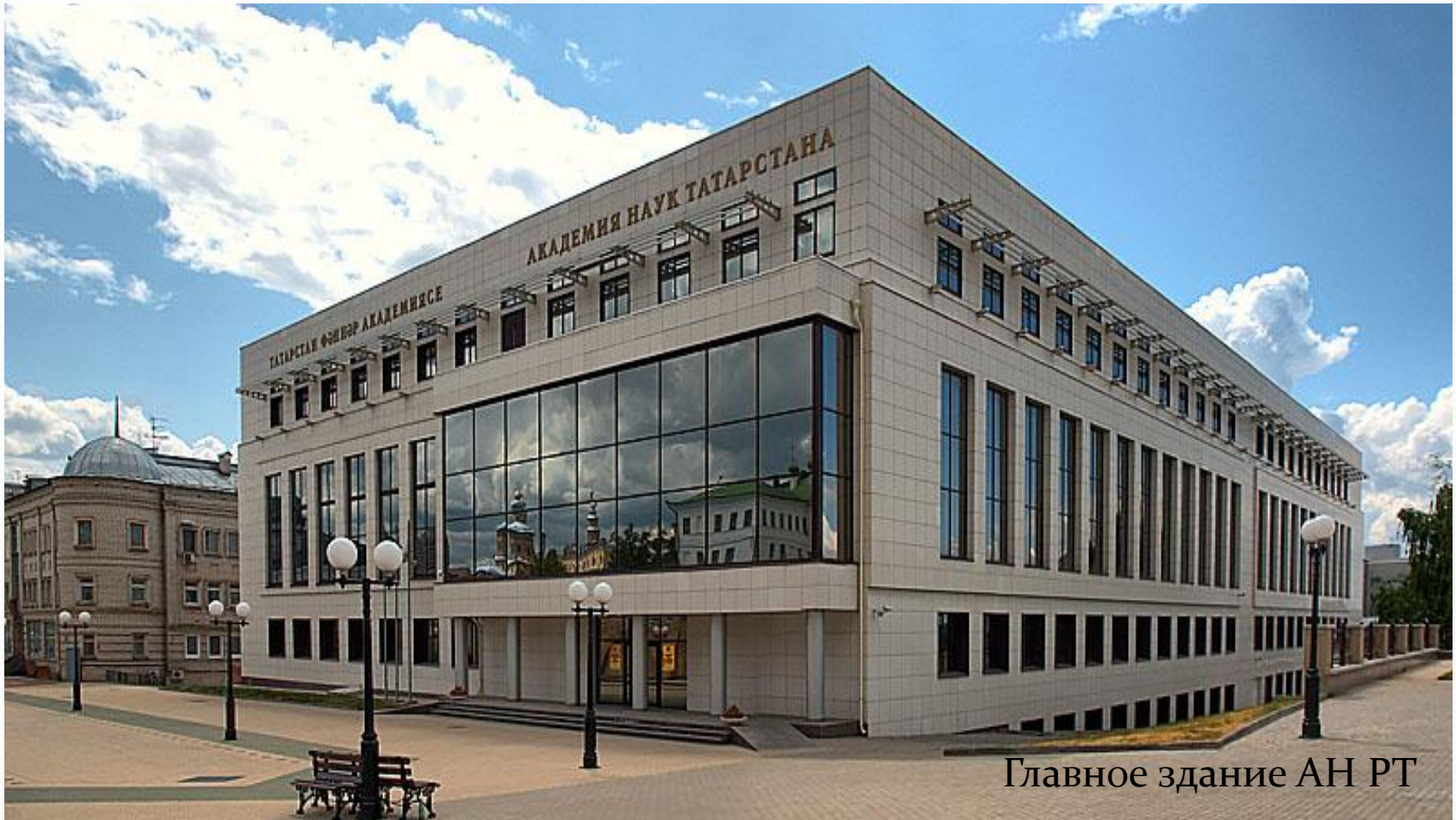
Главное здание АН РТ

Татарстан известен высоким уровнем развития академической, вузовской и отраслевой науки. Более 200 лет Казань является одним из ведущих научных центров Восточной Европы. Здесь появились всемирно известные школы математиков, химиков, астрономов, физиков, востоковедов, лингвистов и физиологов. Имена Н. И. Лобачевского, Н. Н. Зинина, А. М. Бутлерова, А. Е. Арбузова, Е. К. Завойского, В. В. Радлова, К. Фукса, Ш. Марджани и К. Насыри вошли в историю мировой науки.