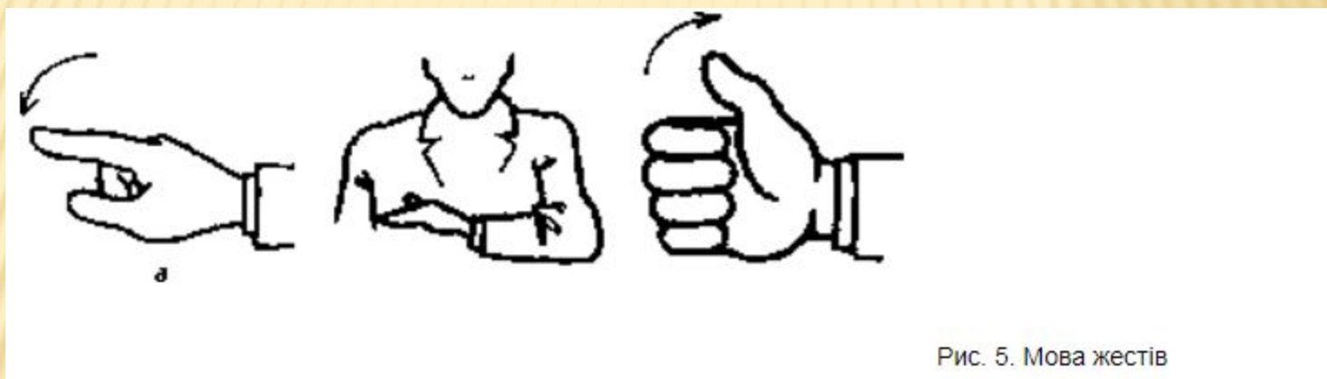
Рис. 5. Мова жестів