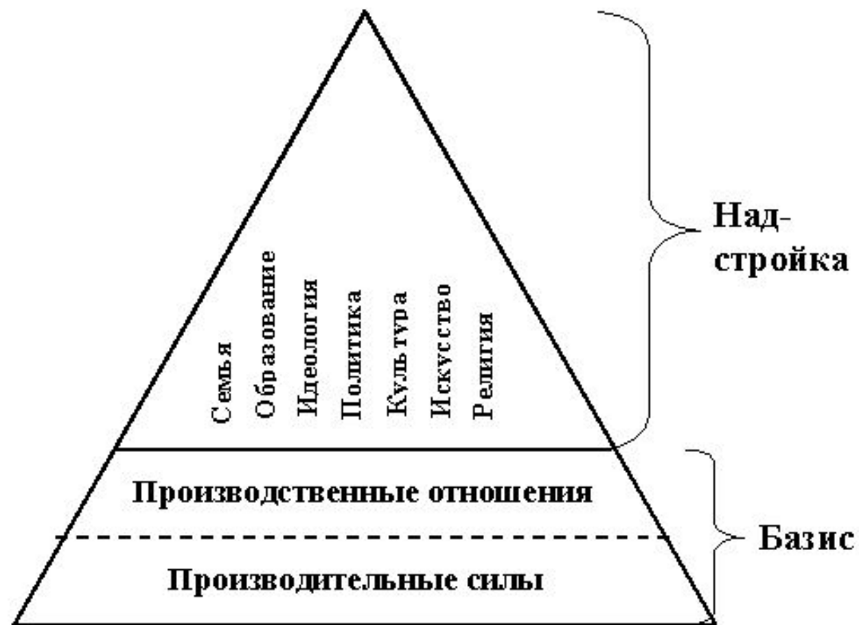
Рис. Модель общества К.Маркса