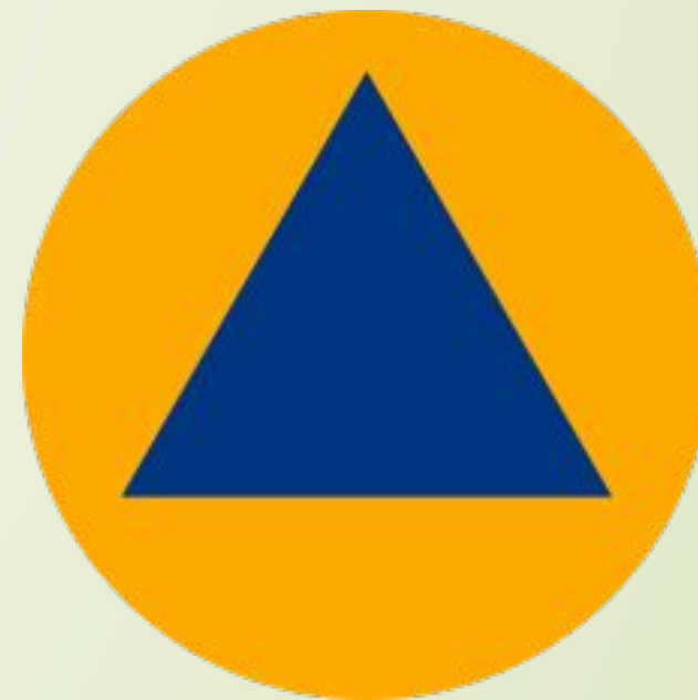
Международный символ гражданской обороны

□ Это специально разработанная система действий и мероприятий, выражающихся в защите населения, культурных и материальных ценностей страны от возникающих в результате военных манипуляций или чрезвычайных происшествий опасностей. А также в подготовке и обучении людей в данной области.