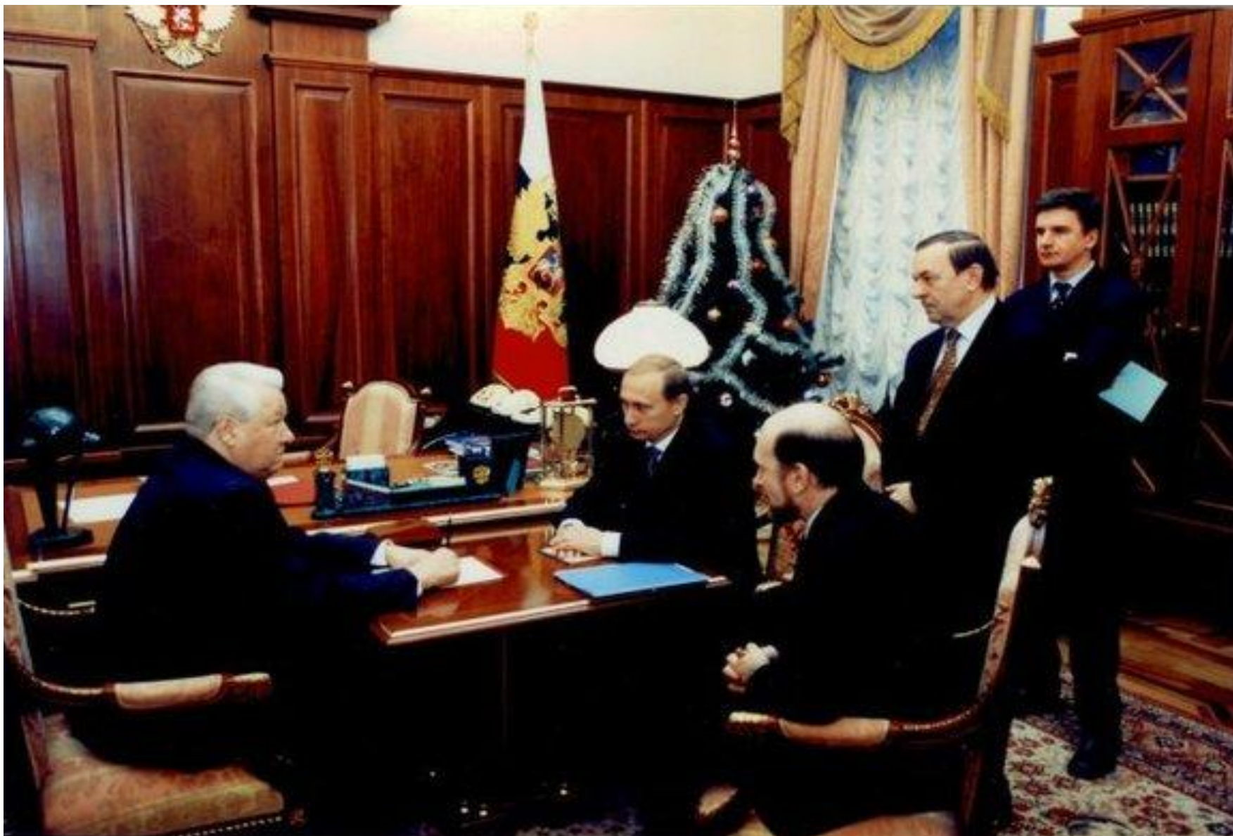
Утро 31 декабря 1999 года в кабинете президента в Кремле.