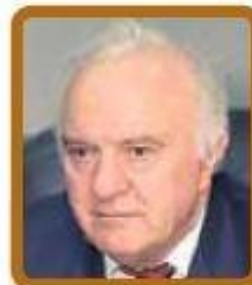
Эдуард Шеварднадзе (Грузия) $410 в месяц