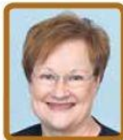
Тарья Халонен (Финляндия) $10 200 в месяц