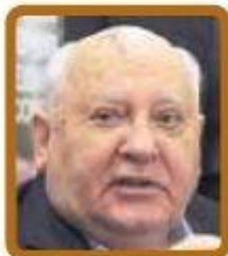
Михаил Горбачев (СССР) $6742 в месяц