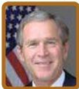
Джордж Буш-младший (США) $16 600 в месяц