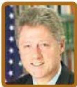
Билл Клинтон (США) $16 600 в месяц