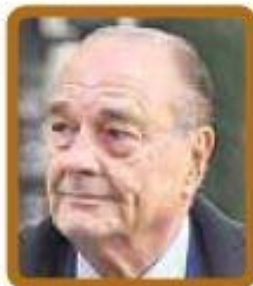
Жак Ширак (Франция) $15 400 в месяц