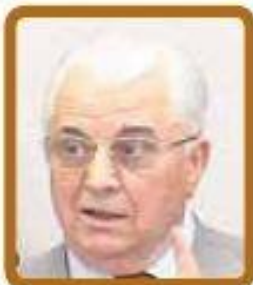
Леонид Кравчук (Украина) $1875 в месяц*