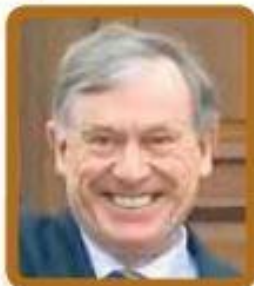
Хорст Кёлер (Германия) $23 000 в месяц