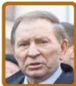
Леонид Кучма (Украина) $1875 в месяц*