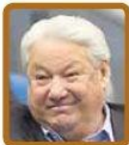
Борис Ельцин (Россия) $3000 в месяц