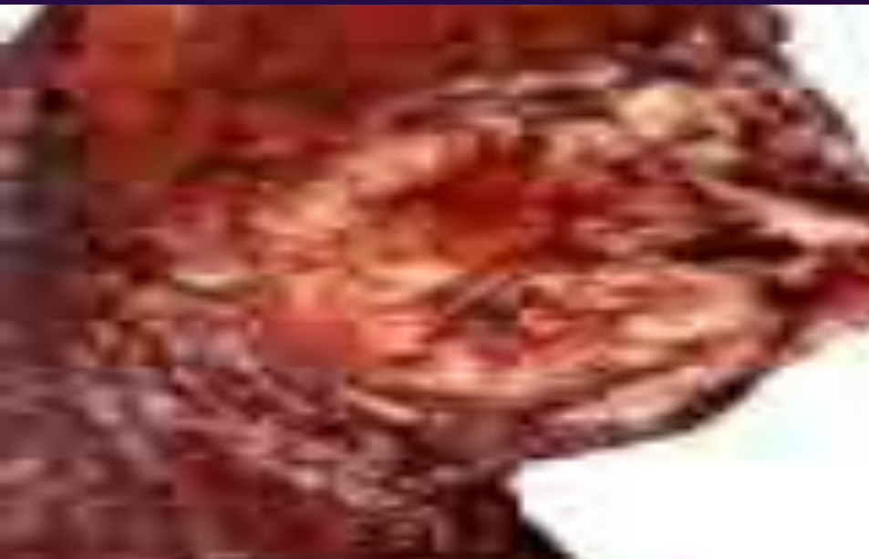
Легкие после 5 лет курения