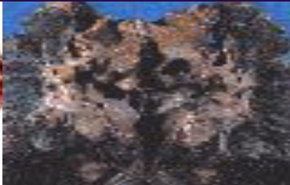
Легкие после 25 лет курения