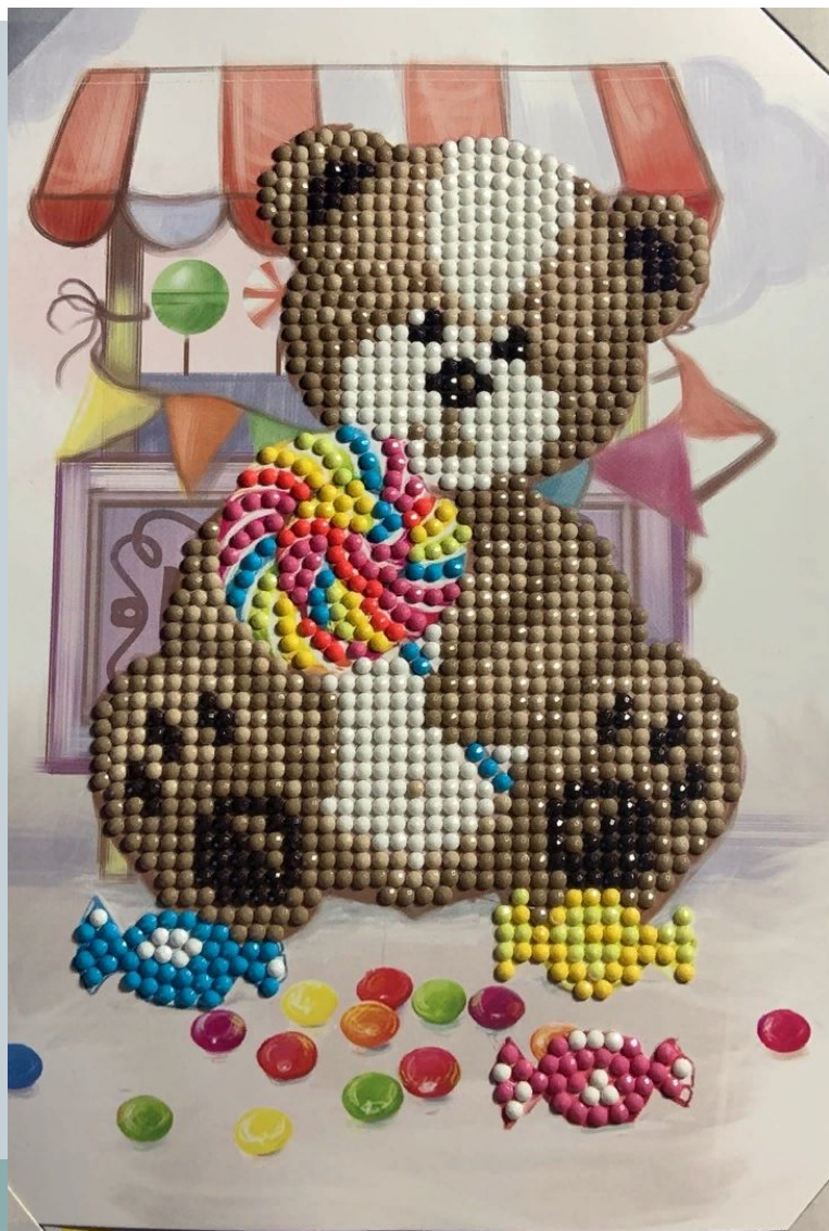
Фото изделия. Выводы

Моя готовая работа, сделана качественно и красиво!