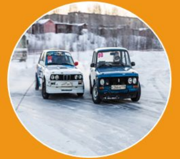
Организаторы команды DMS и координаторы чемпионата FDS по дрифту: