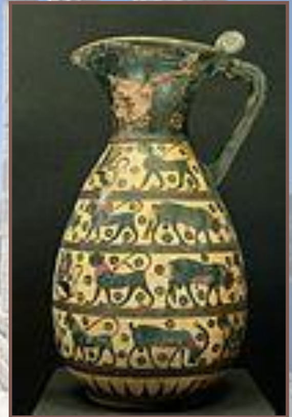
Ольпа в ориентализирующем стиле

Начиная с 725 г. до н. э. в изготовлении керамики лидирующее положение занимает Коринф. Начальный период, которому соответствует ориентализирующий, или иначе протокоринфский стиль, характеризуется в вазописи увеличением фигурных фризов и мифологических изображений. Положение, очерёдность, тематика и сами изображения оказались под влиянием восточных образцов, для которых были прежде всего характерны изображения грифонов, сфинксов и львов.