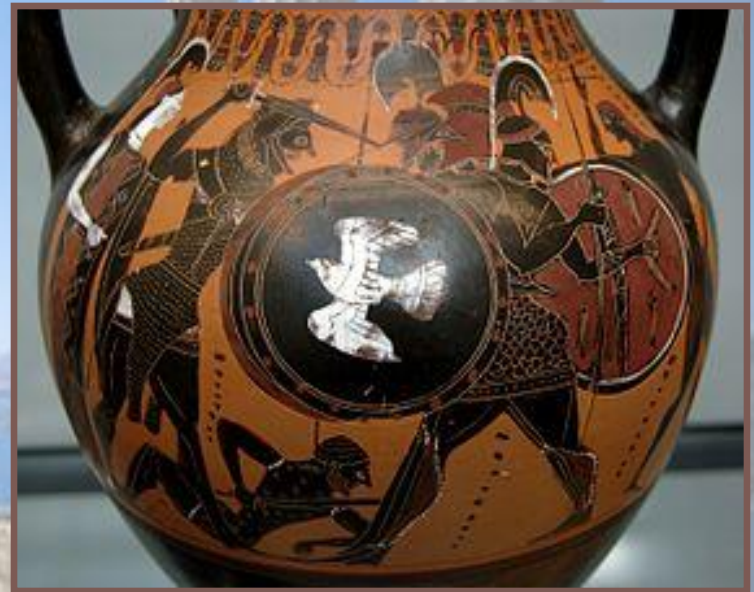
Аттическая чернофигурная амфора. Геракл и Герион. Ок. 540 г. до н. э.

Со второй половины VII в. до начала V в. до н. э. чернофигурная вазапись развивается в самостоятельный стиль украшения керамики. Всё чаще на изображениях стали появляться человеческие фигуры. Композиционные схемы также подверглись изменениям. Наиболее популярными мотивами изображений на вазах становятся пиршества, сражения, мифологические сцены, повествующие о жизни Геракла и о Троянской войне.