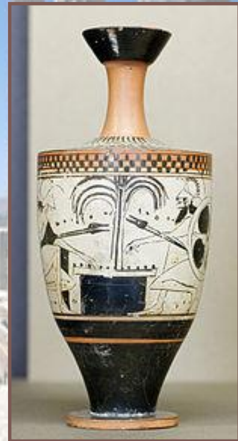
Лекиф с изображением Ахилла и Аякса, к 500 г. до н. э.

Для росписи ваз в этом стиле в качестве основы использовалась белая краска, на которую наносились чёрные, красные либо многоцветные фигуры. Эта техника вазописи применялась преимущественно в росписи лекифов, арибалов и алабастронов.