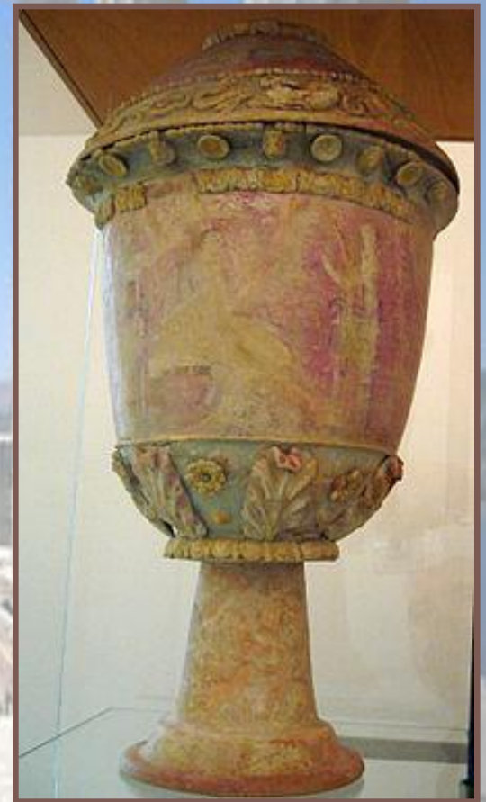
Чентурипская ваза, 280—220 гг. до н. э.

Чентурипские вазы получили лишь местное распространение в Сицилии. Керамические сосуды составлялись воедино из нескольких частей и не использовались по своему прямому назначению, а лишь вкладывались в захоронения. Для росписи чентурипских ваз использовались пастельные тона по нежно-розовому фону, вазы украшались крупными скульптурными изображениями людей в одеждах разных цветов и великолепными аппликативными рельефами.