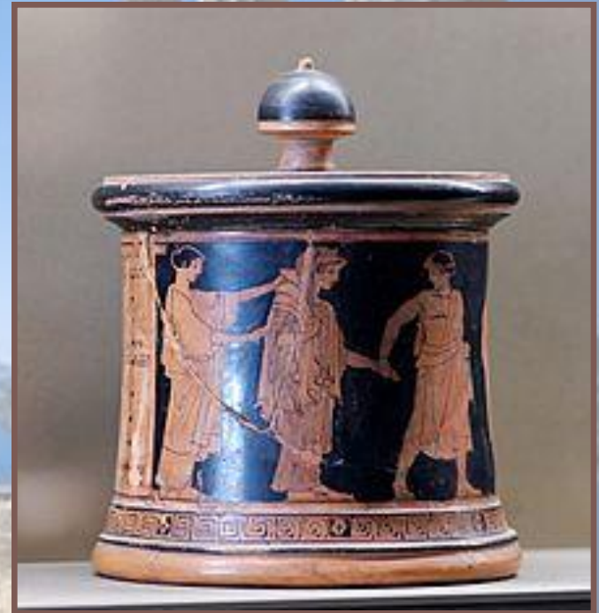
Свадьба Фетиды. Пиксида вазаписца свадеб. Ок. 470—460 г. до н. э.

Краснофигурные вазы впервые появились около 530 г. до н. э. Считается, что эту технику впервые применил живописец Андокид. В отличие от уже существовавшего распределения цветов основы и изображения в чернофигурной вазаписи, чёрным цветом стали красить не силуэты фигур, а наоборот фон, оставляя фигуры незакрашенными. Отдельными щетинками на неокрашенных фигурах прорисовывались тончайшие детали изображений.