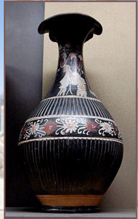
Ойнохойя-гнафия. 300—290 гг. до н. э.

Вазы-гнафии, названные по месту первого их обнаружения в Гнафии (Апулия), появились в 370—360 гг. до н. э. Эти вазы родом из нижней Италии получили широкое распространение в греческих метрополиях и за их пределами. В росписи гнафий по чёрному лаковому фону использовались белый, жёлтый, оранжевый, красный, коричневый, зелёный и другие цвета. На вазах встречаются символы счастья, культовые изображения и растительные мотивы.