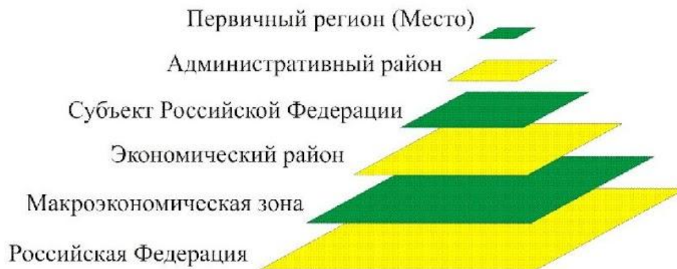
Рисунок – Иерархия регионов

В соответствии с изложенными представлениями о районировании России любой регион является элементом некоторой иерархической системы регионов. Первичным элементом системы является «место» - предельно малый регион (теоретически это географическая точка).