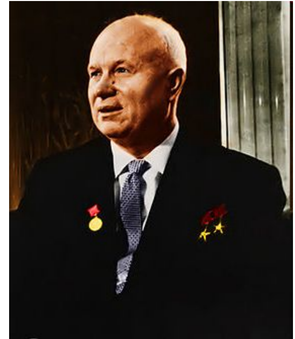
Никита Сергеевич Хрущёв

Больше всех от падения Берии выиграл Н.С. Хрущев