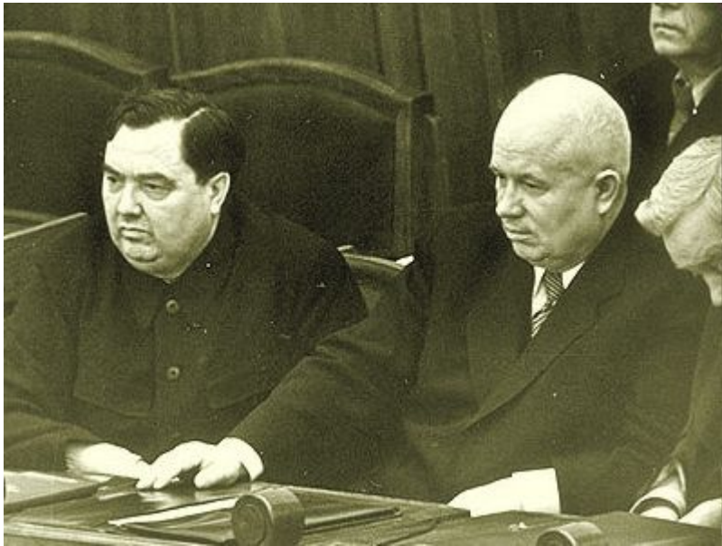
Г.А. Маленков и Н.С. Хрущёв

С лета 1953 г. по февраль 1955 г. борьба за власть вступает во второй этап, когда на вершине власти оказались Г. Маленков и Н. Хрущев (избранный в сентябре 1953 г. первым секретарем ЦК)