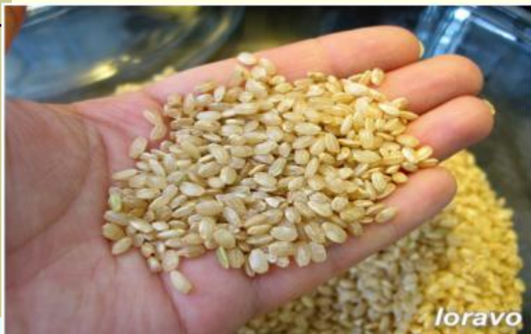
Рис - 9/10 мирового сбора приходится на страны Азии - Китай, Индию, Индонезию, Японию