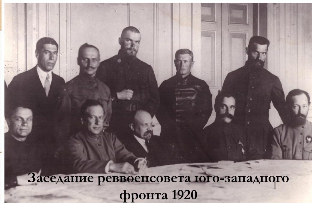
Заседание реввоенсовета юго-западного фронта 1920