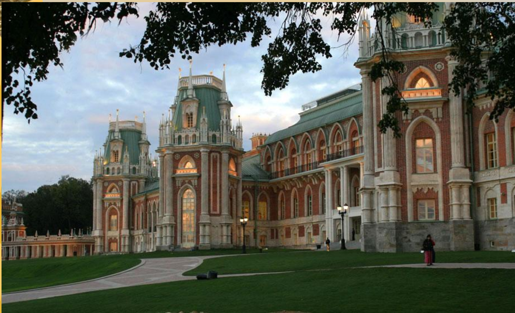
Дворцовый ансамбль в Царицыно. 1775 – 1785 гг. Москва.