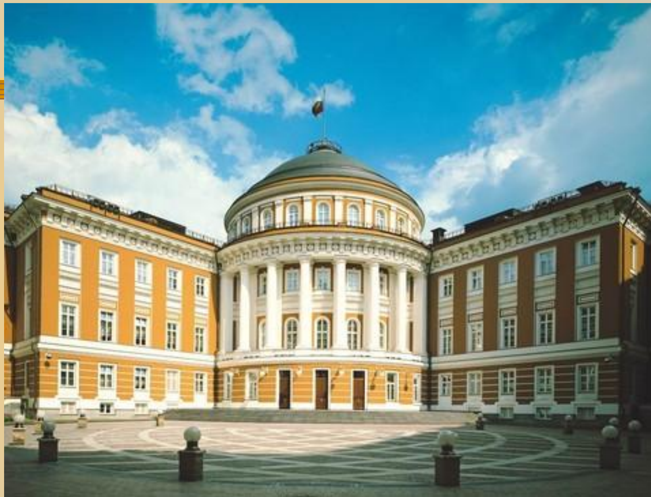
Здание Сената в Кремле. 1783г.