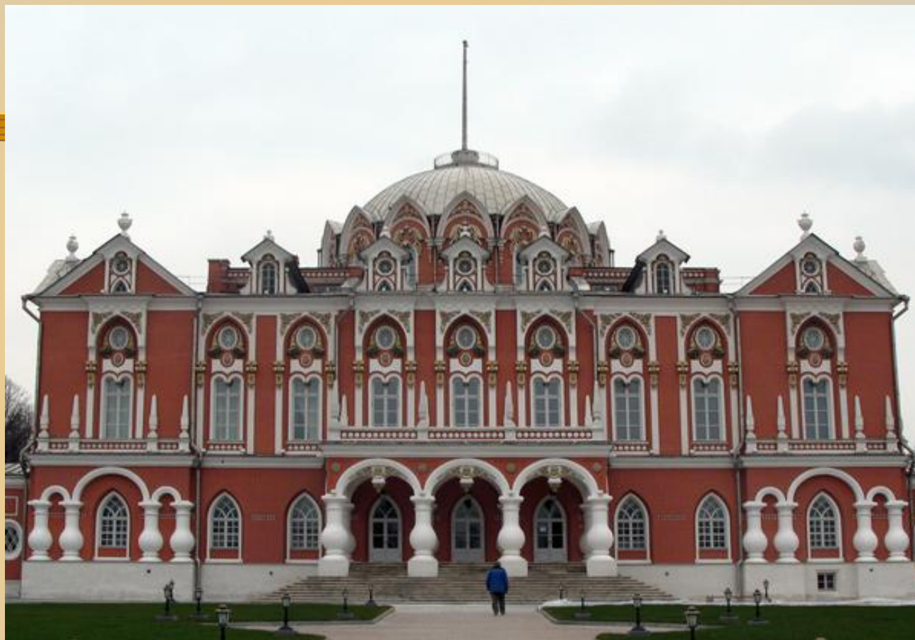
Петровский дворец. 1775 – 1782 гг. Москва.