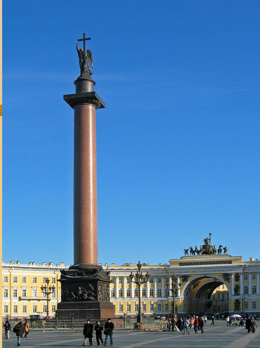
Александровская колонна. Санкт-Петербург. Дворцовая площадь. 1834г.