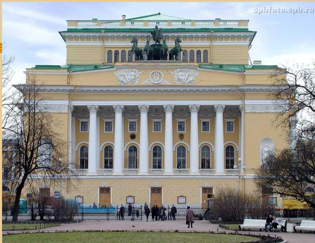
Александринский театр. Санкт-Петербург. 1832 г.