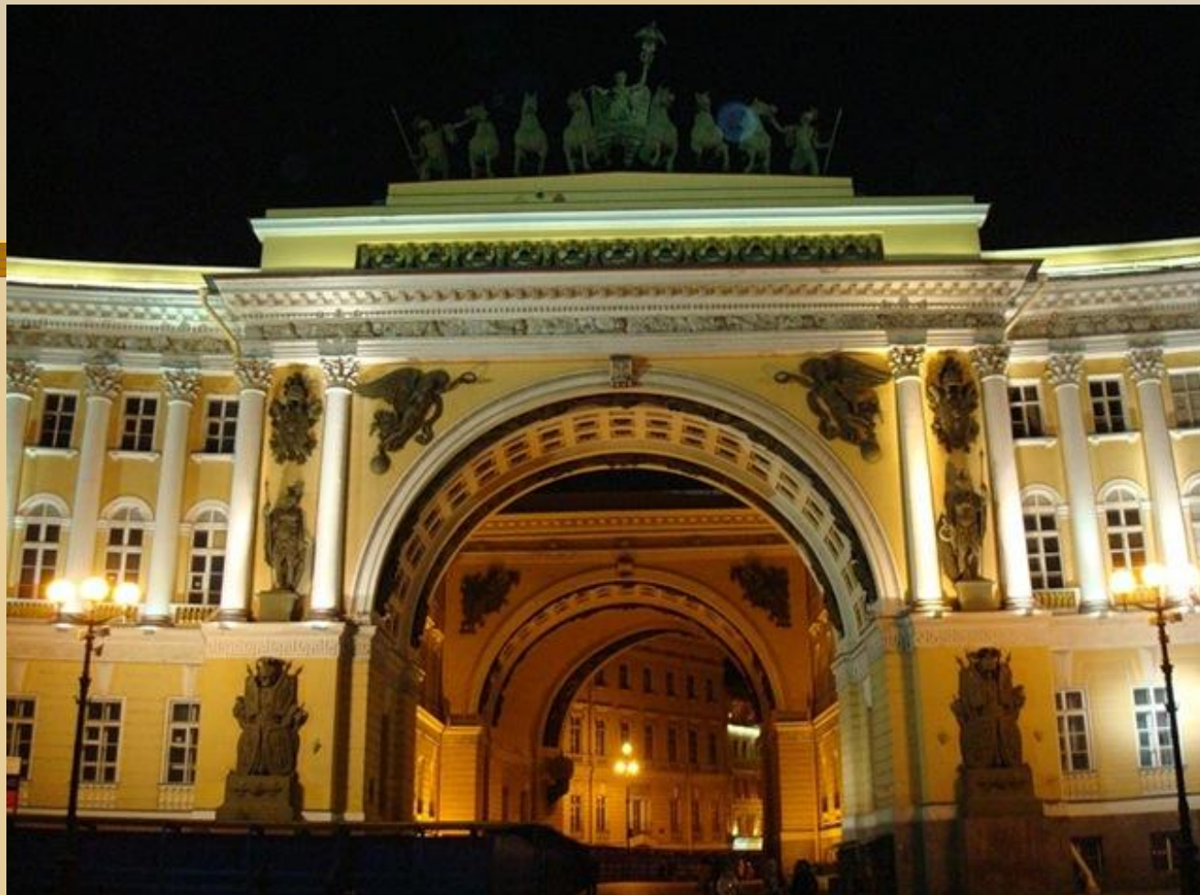
Здание главного штаба. Санкт-Петербург 1819-1829гг.