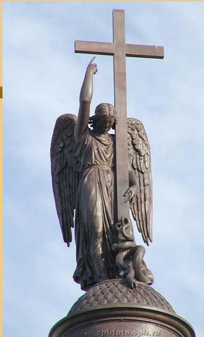
Ангел на Александровской колонне.