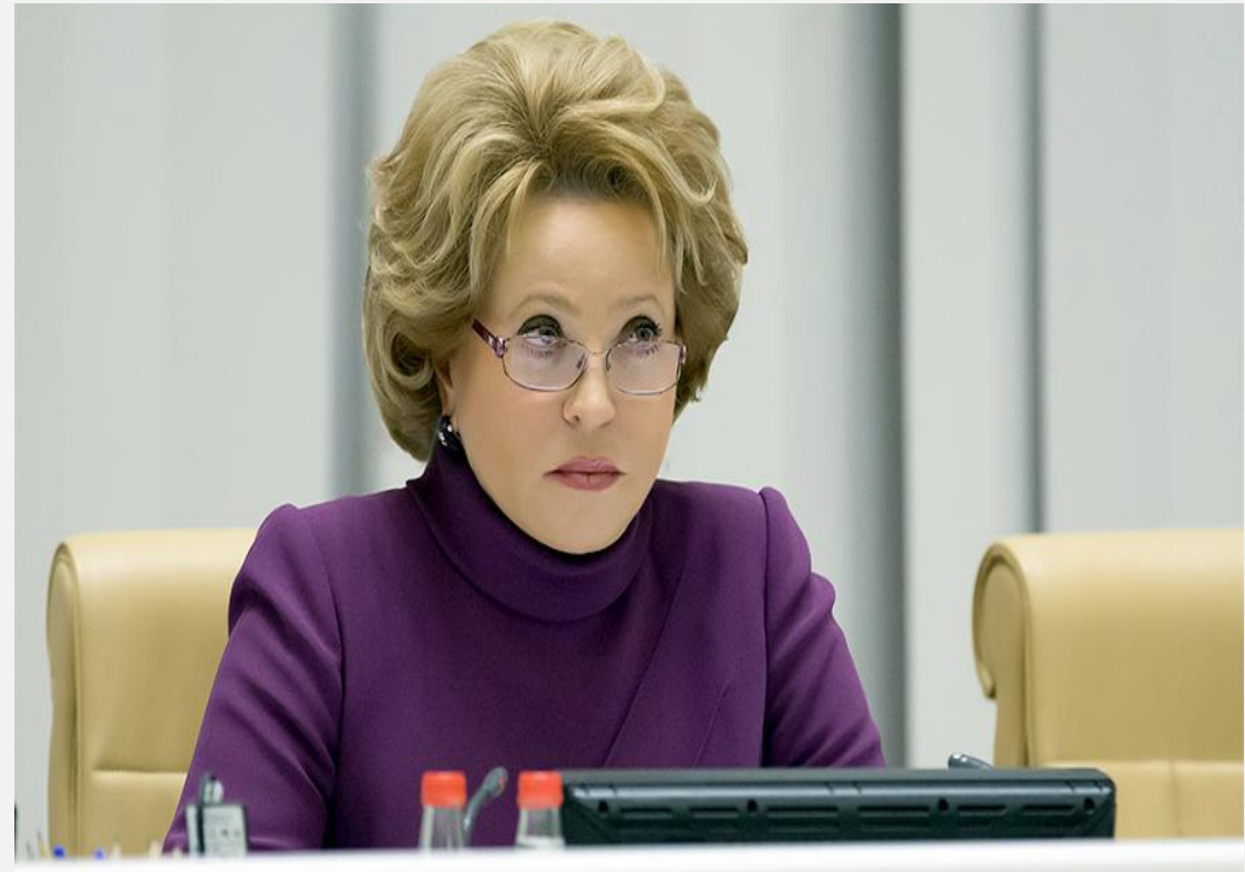
Валентина Ивановна Матвиенко