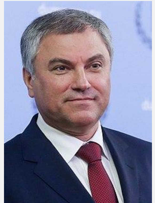
Вячеслав Викторович Володин