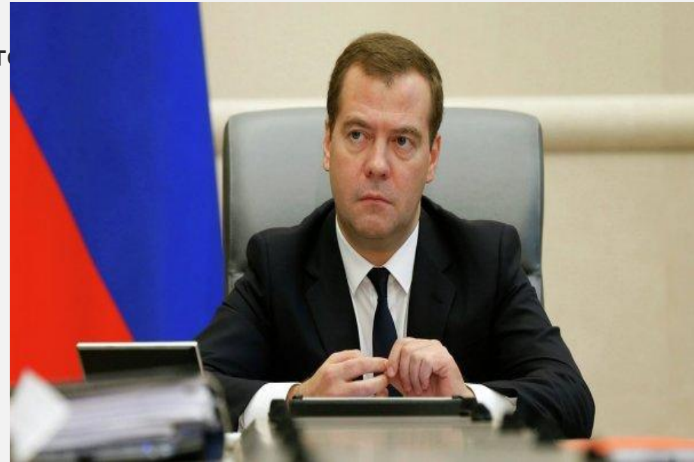
Дмитрий Анатольевич Медведев