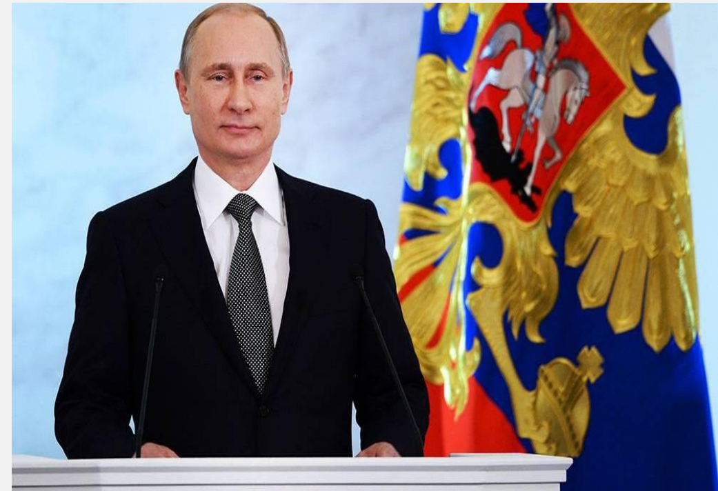
Владимир Владимирович Путин