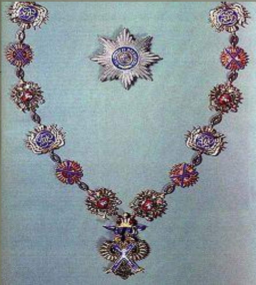
Орден Святого апостола Андрея Первозванного (1703)