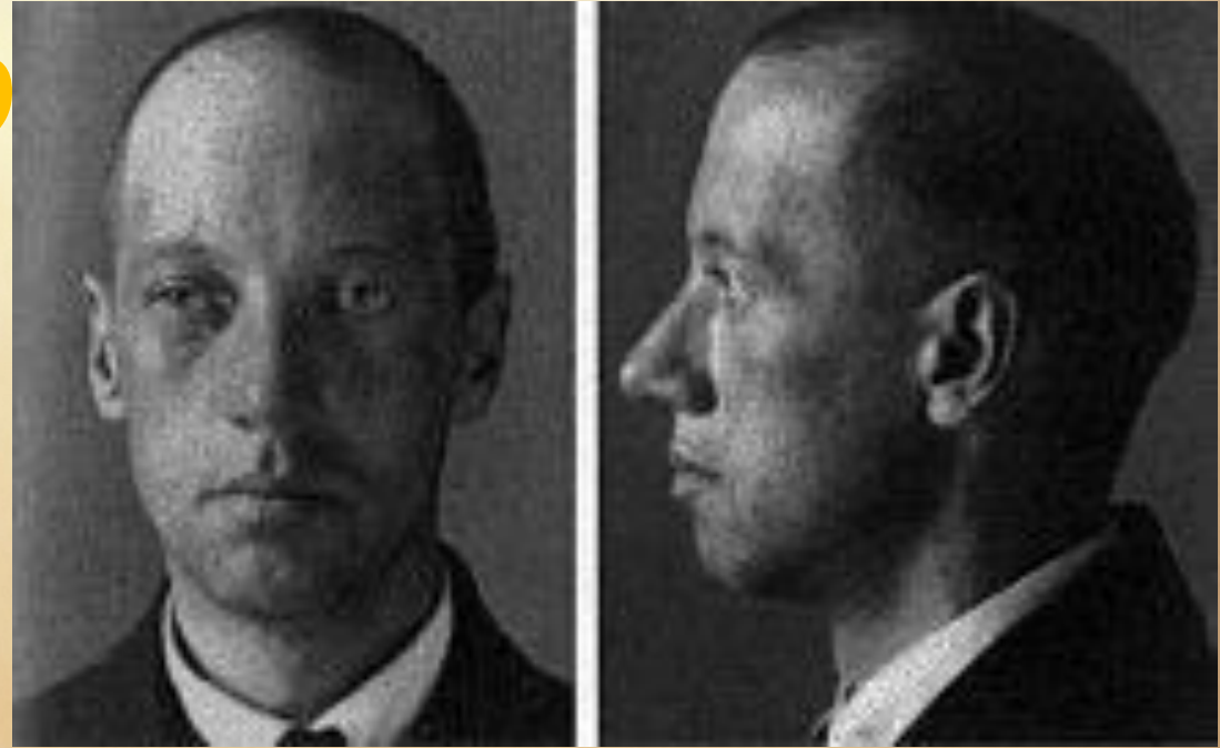
Фото Гумилёва из следственного дела 1921 г.