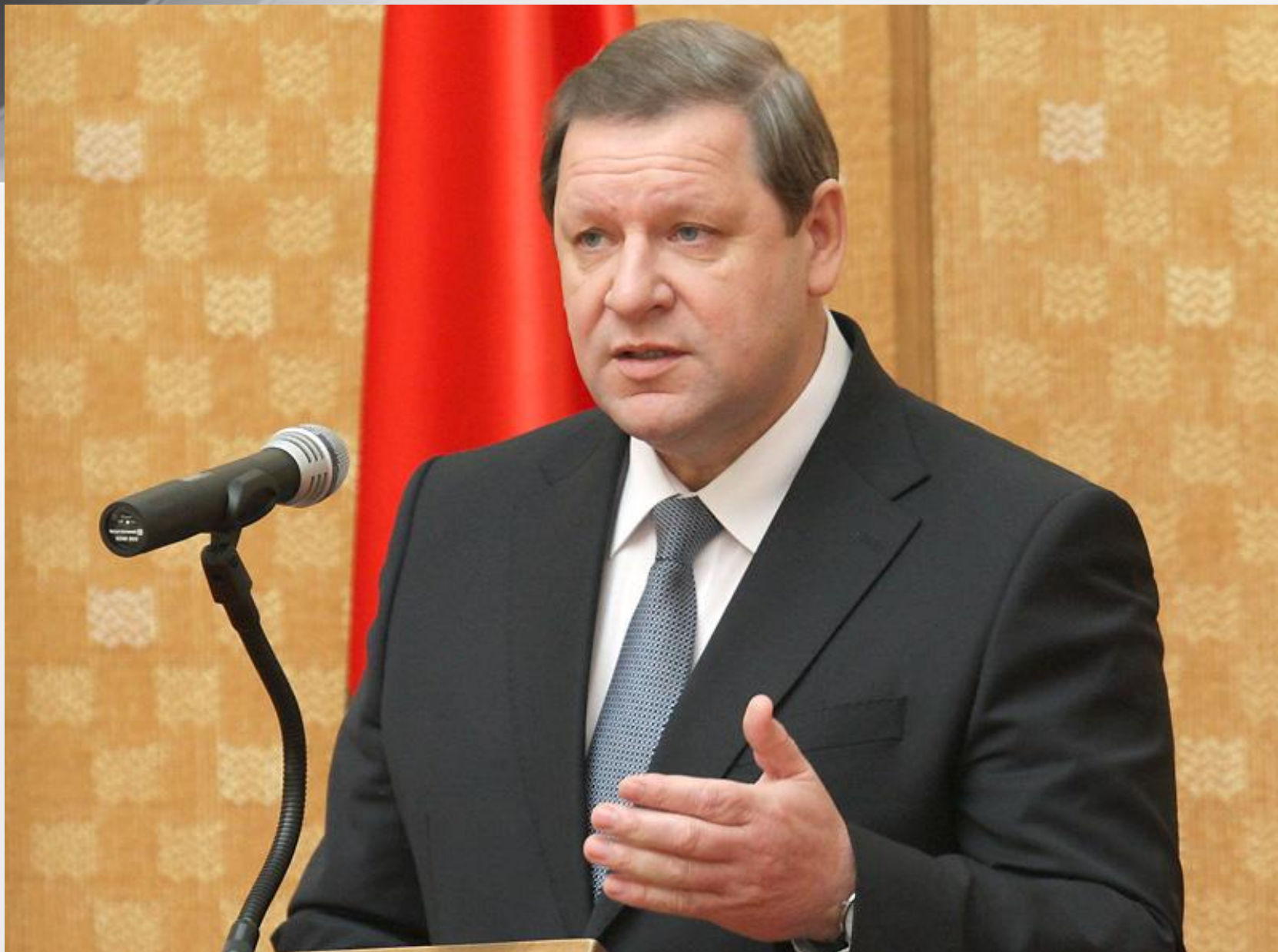
Прэм'ер-міністр Беларусі Сяргей Сідорскі