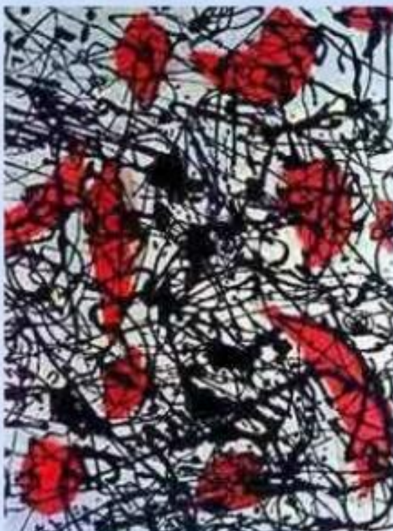
Дж. Поллок «№ 15»