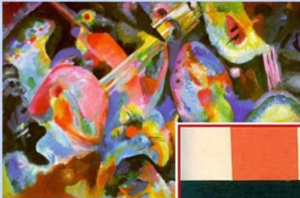
В.В.Кандинский «Наплыв импровизации»