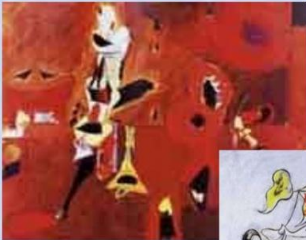
Арчи Горки «Композиция в красном»