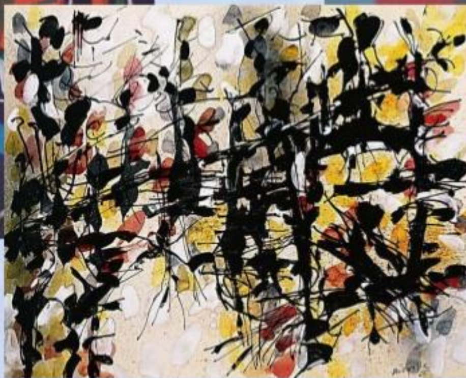
Жан-Поль Риопель «Без названия»