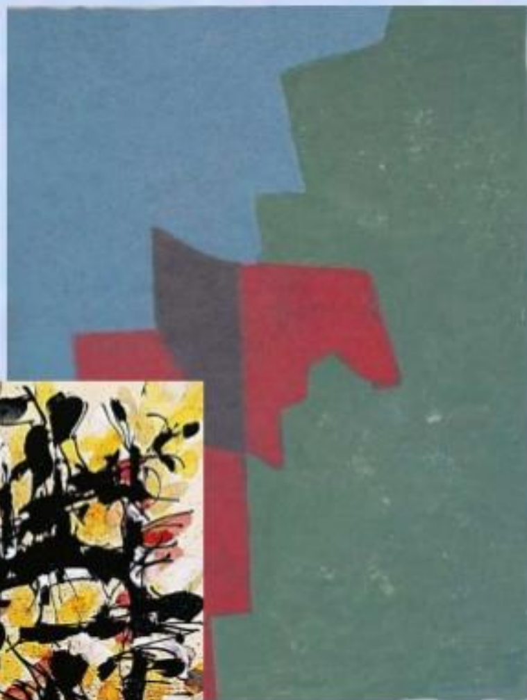
С.Поляков «Красный, зеленый и голубой»