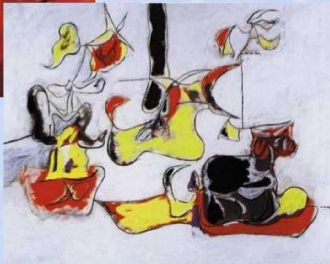
Арчи Горки «Сад в Сочи»