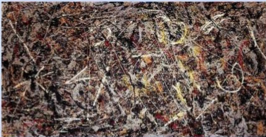
Дж. Поллок «Алхимия»