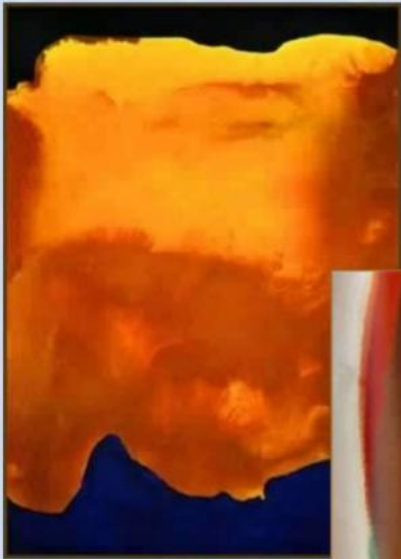
Морис Луис «Nun»