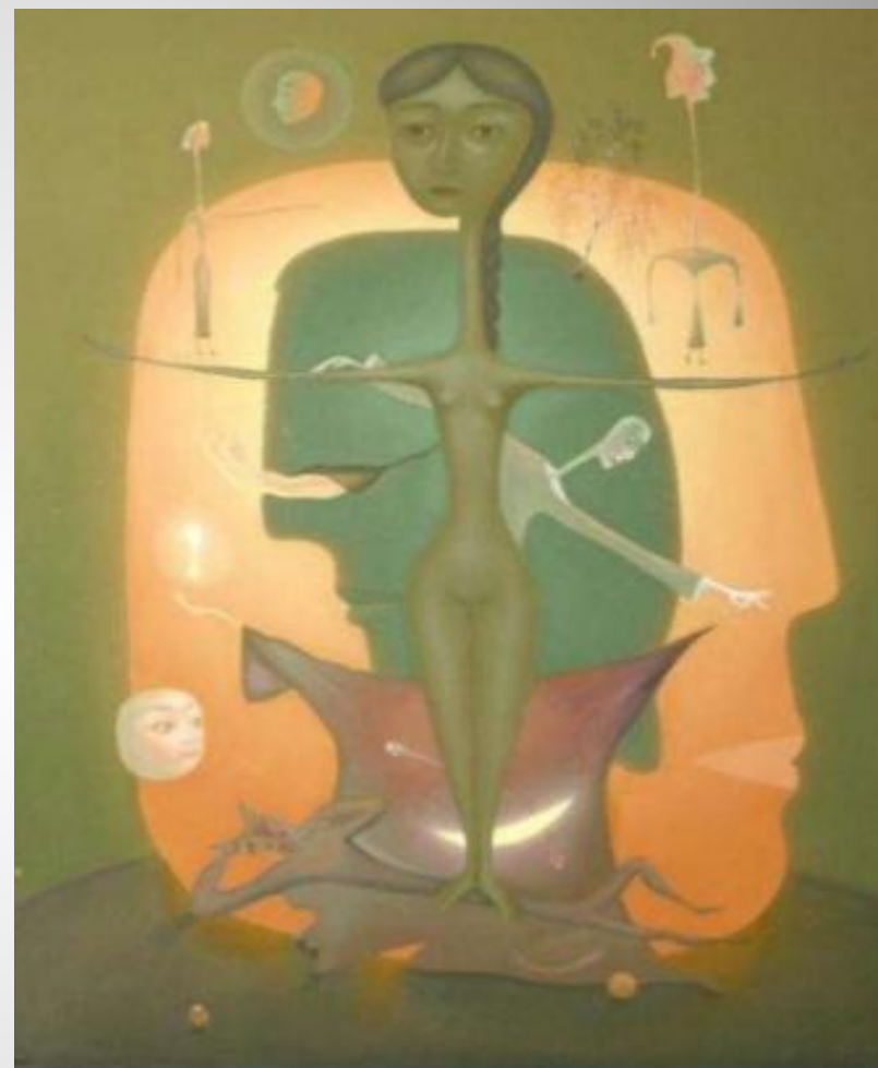
В.Н.Заваровский «Анатомия души»