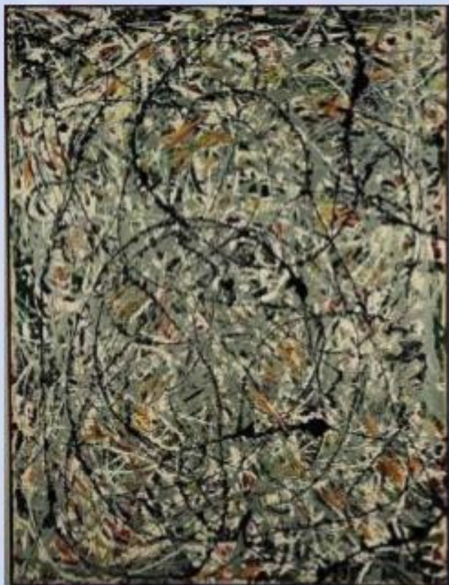
Дж. Поллок «Волнистые линии»