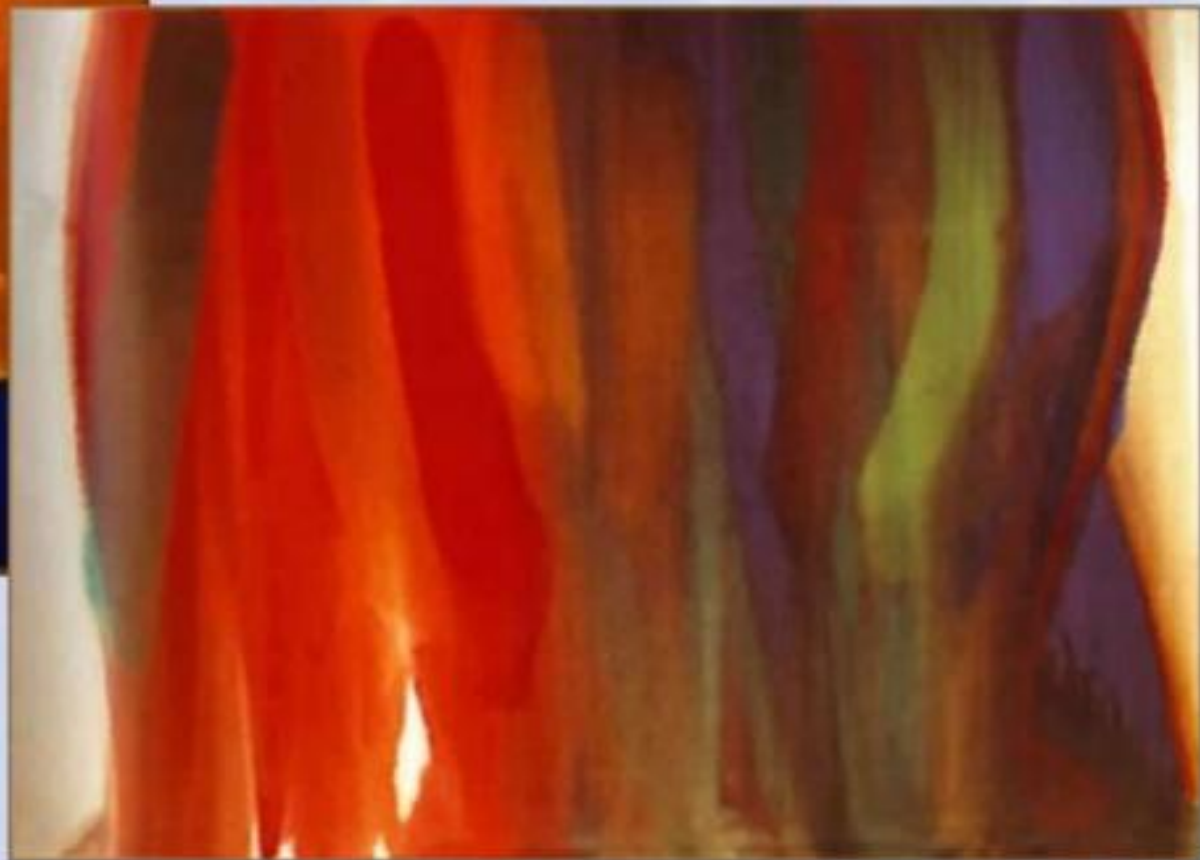
Э. Франкенталер «Magic Carpet»