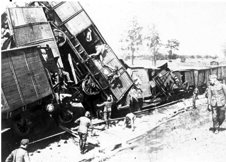
Крушение немецкого военного эшелона, организованного одним из отрядов партизан

По своим масштабам «Рельсовая война» приобрела стратегический характер. Начатая в ночь на 3 августа 1943 года в разгар ожесточенного сражения на Курской дуге, она развернулась на огромном пространстве протяженностью по фронту на 1000 км и в глубину 750 км, и продолжалась до середины сентября 1943 года. В операции приняли участие около 100 тысяч бойцов партизанских формирований и десятки тысяч человек мирного населения.