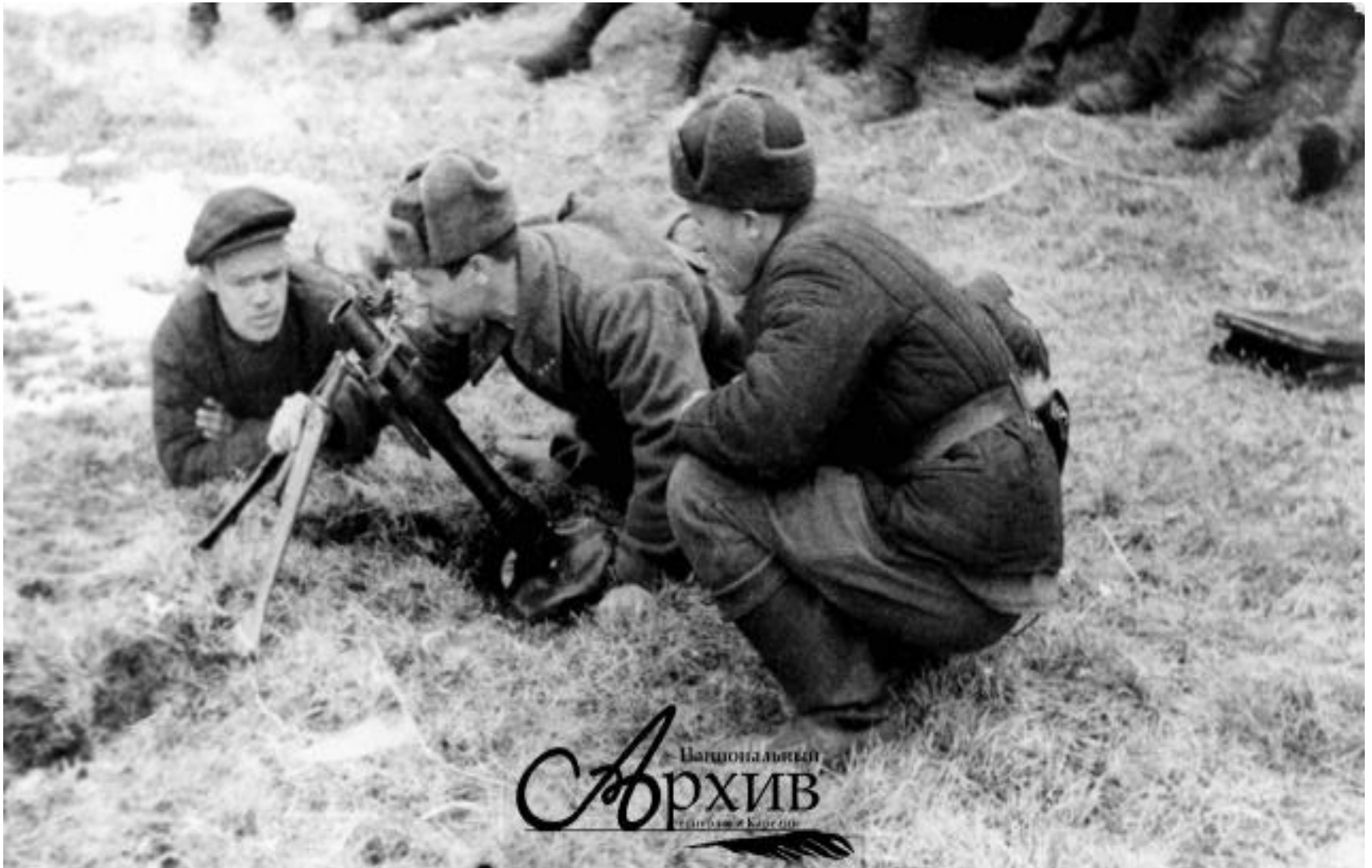
Бойцы партизанского отряда «Вперед» изучают устройство нового миномета. Тунгудский район, д. Лехта. 1942 г.