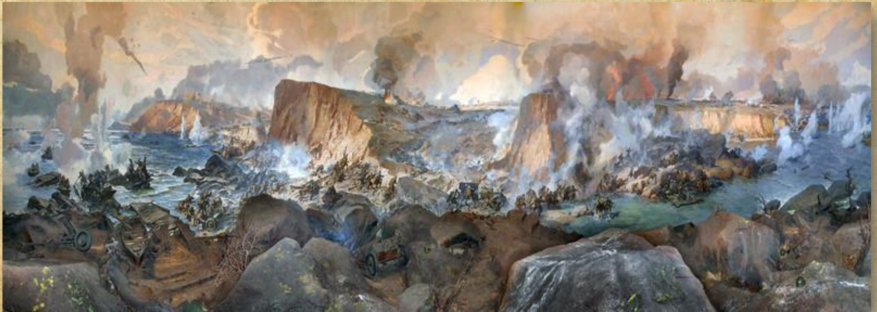
Диорама "Битва за Днепр"