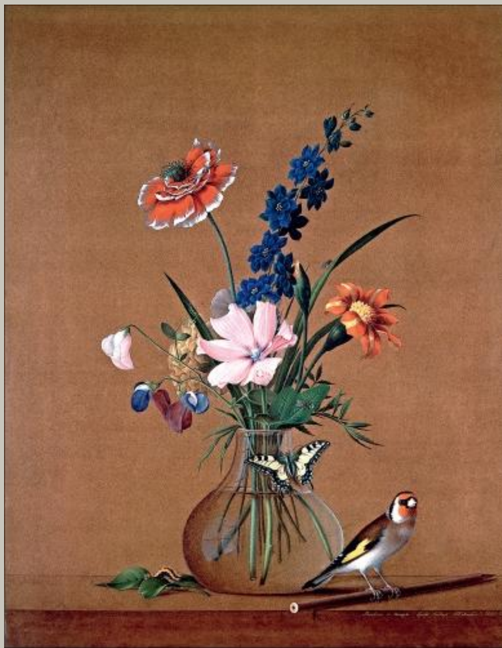
«Букет цветов, бабочка и птичка»