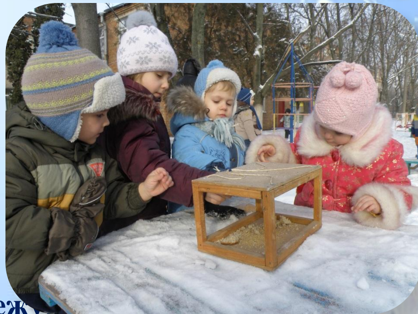
Организация дежурства «Птичьей столовой»