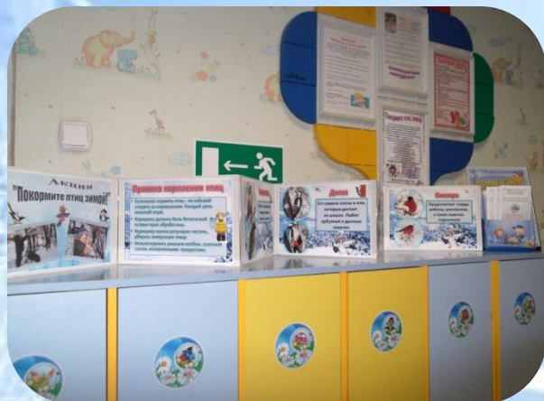
Папка-передвижка «Покормите птиц зимой»