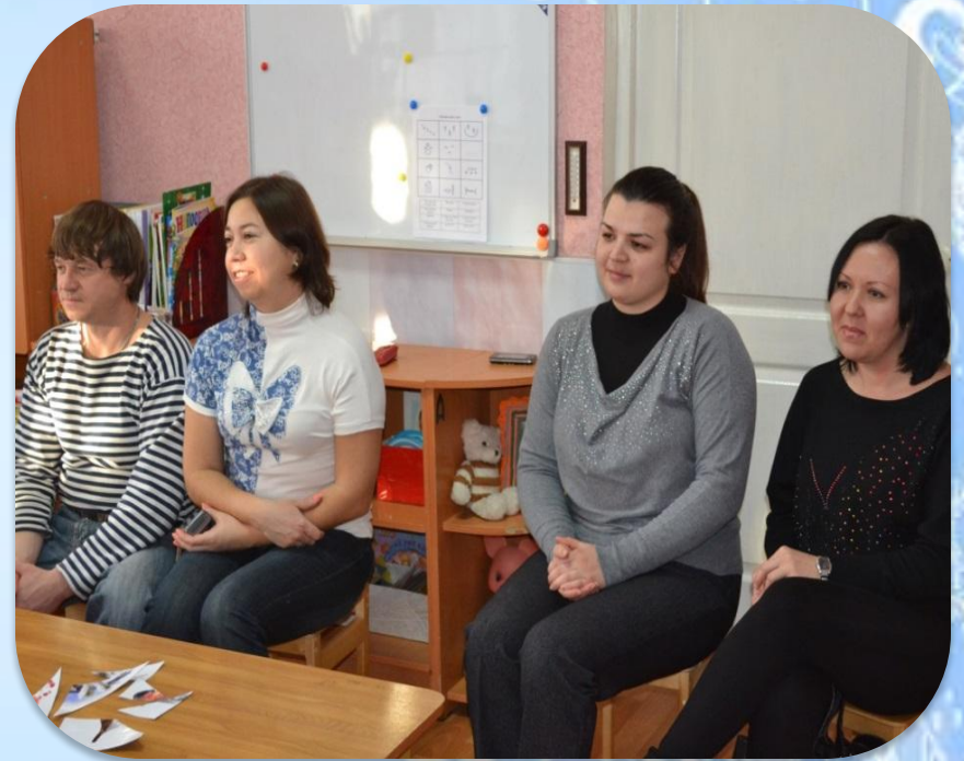
Просмотр открытого занятия «Птицы – наши друзья».