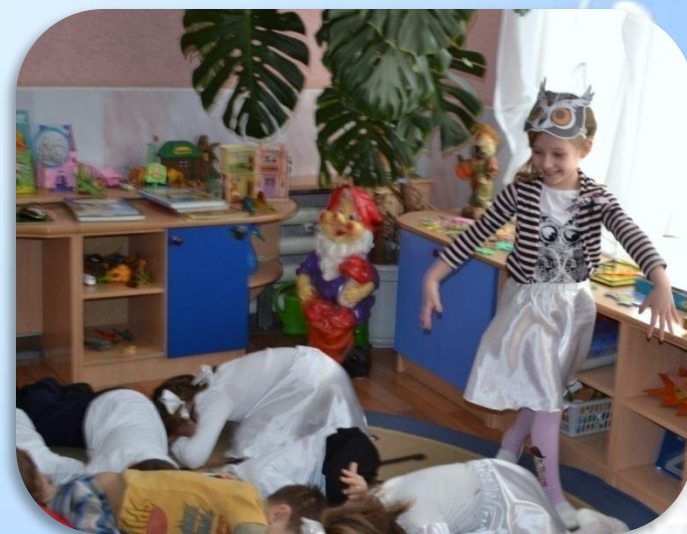
Игра – путешествие «На планете Доброты»