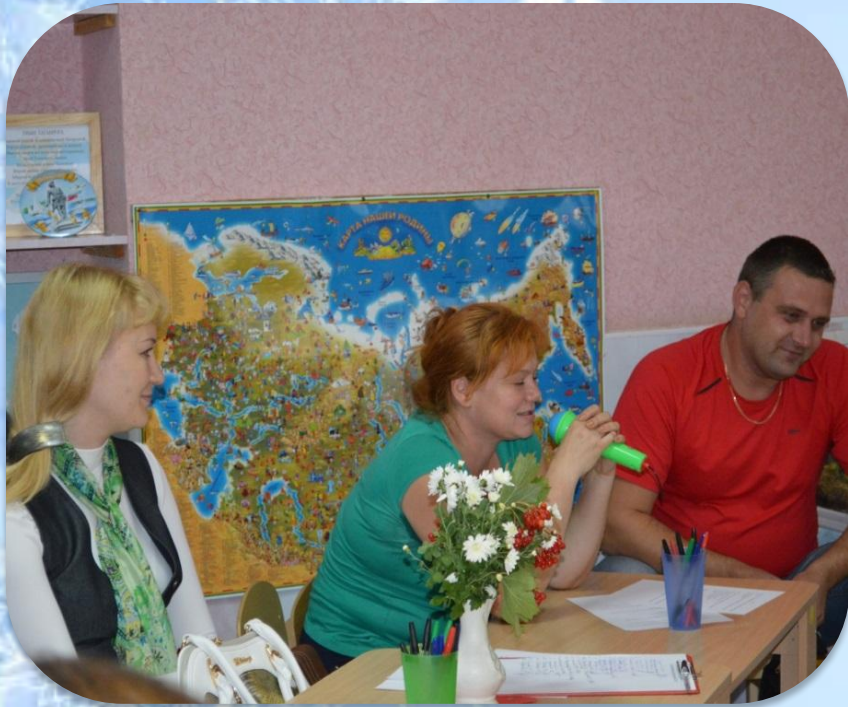
Интервью родителей «Что значит беречь природу»