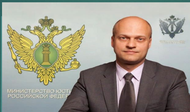
Новак Денис Васильевич

Уполномоченный Российской Федерации при Европейском Суде по правам человека - заместитель Министра юстиции Российской Федерации