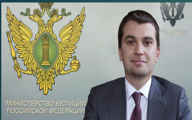
Гальперин Михаил Львович

Уполномоченный Российской Федерации при Европейском Суде по правам человека - заместитель Министра юстиции Российской Федерации