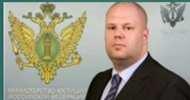
Любимов Юрий Сергеевич

Первый заместитель Министра юстиции Российской Федерации