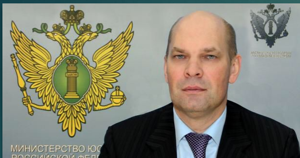
Плохой Олег Анатолевич

Первый заместитель Министра юстиции Российской Федерации