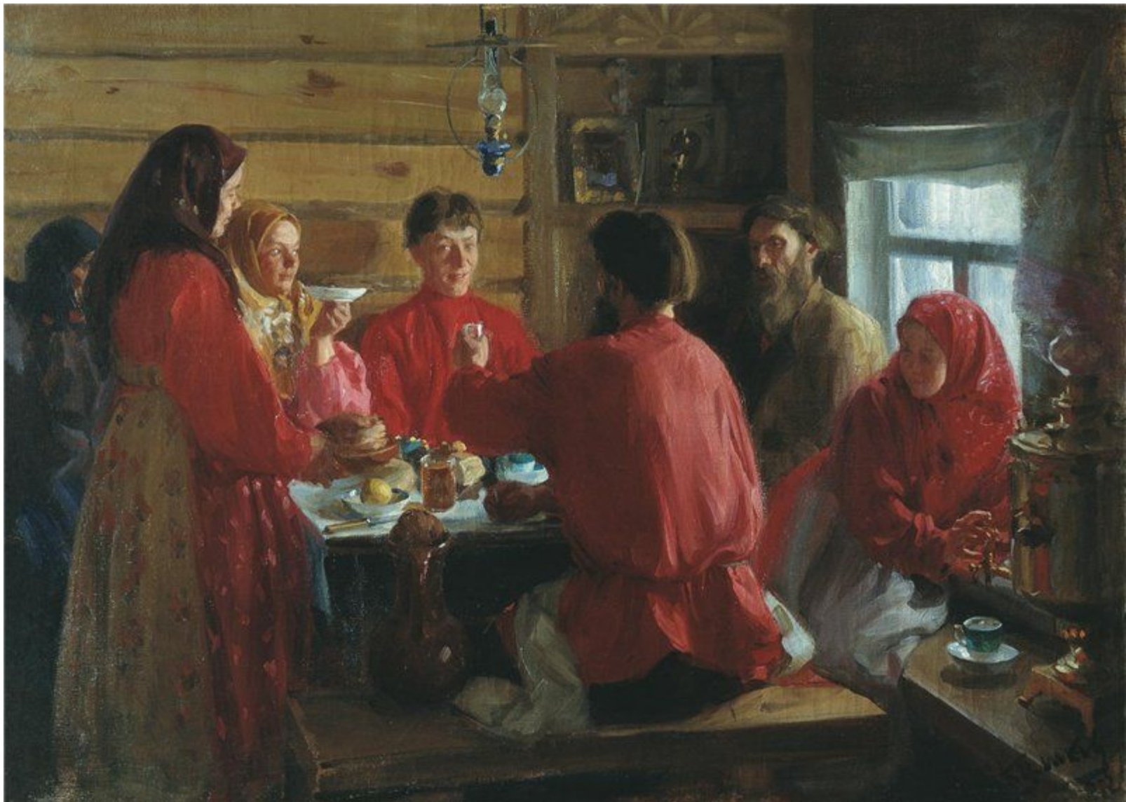
Традиционная или патриархальная семья.