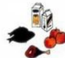
Пить воду и употреблять пищу — только после лабораторного контроля!