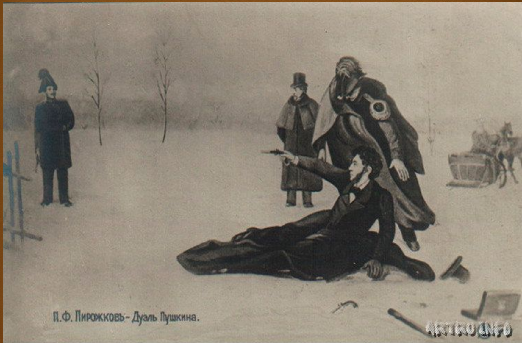
П. Ф. Пирожковъ - Дуэль Пушкина.