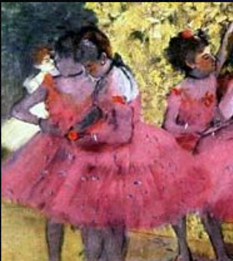
Красные танцовщицы; 1884

Он показывает все стороны театра: феерию и рутину, красивые представления и утомительные репетиции. Он стремится передать мгновенное, неуловимое движение — отсюда его интерес к миру театра, кулис, балету, цирку: балерины, оркестр, азартные, ловкие жокеи, взволнованные толпы зрителей.