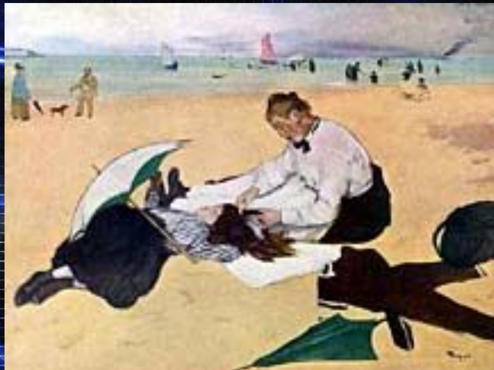
Маленькая девочка с бонной на пляже. 1876-1877 г

Дега тонкий колорист, его пастели то гармоничные, светлые, то, напротив, построены на резких цветовых контрастах. Картины его кажутся случайно выхваченными из потока жизни сценами, но «случайность» эта — плод продуманной композиции, где срезанный фрагмент фигуры, здания подчеркивает непосредственность впечатления.