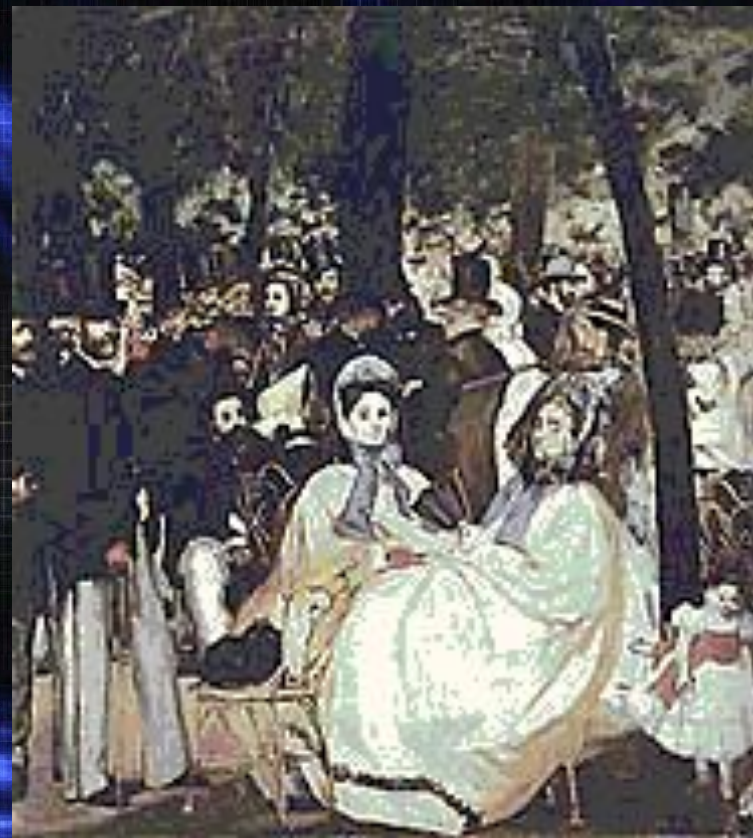
«Музыка в Тюильри», 1862, Лондон

Увлечение испанской темой заметно ослабеваает после поездки в Испанию в 1865. Картина «Музыка в Тюильри»- образ нарядно одетой толпы в оболочке бытового жанра