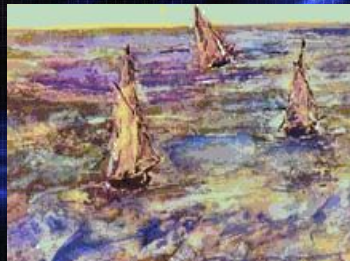
«Морской пейзаж», 1873