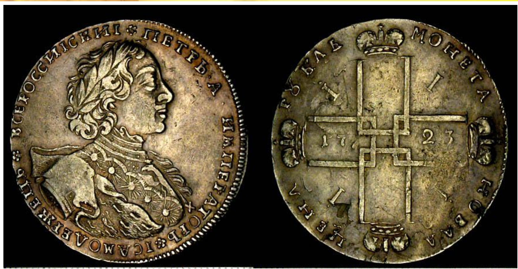
Рубль Петра I