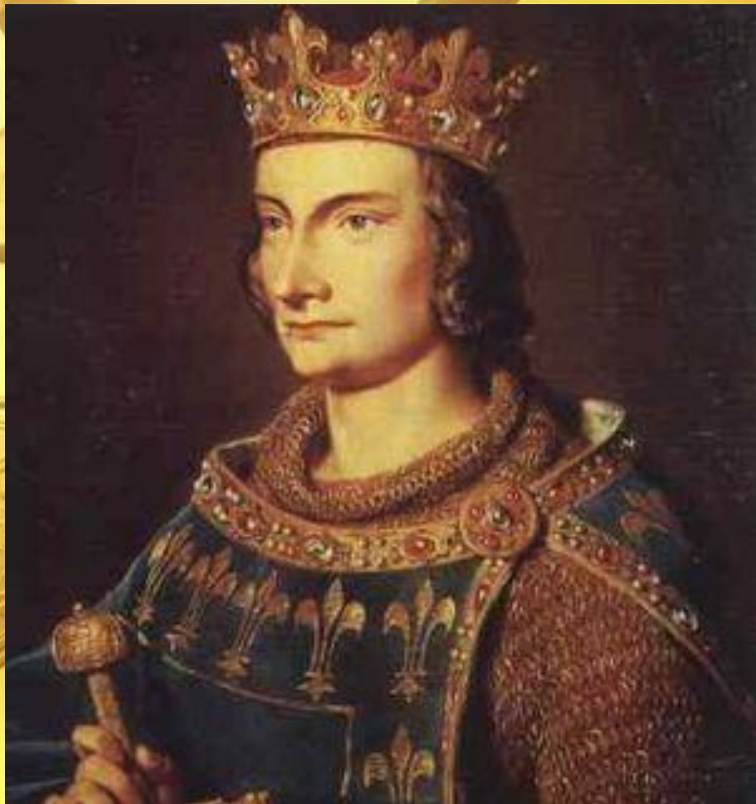
Филипп IV Красивый