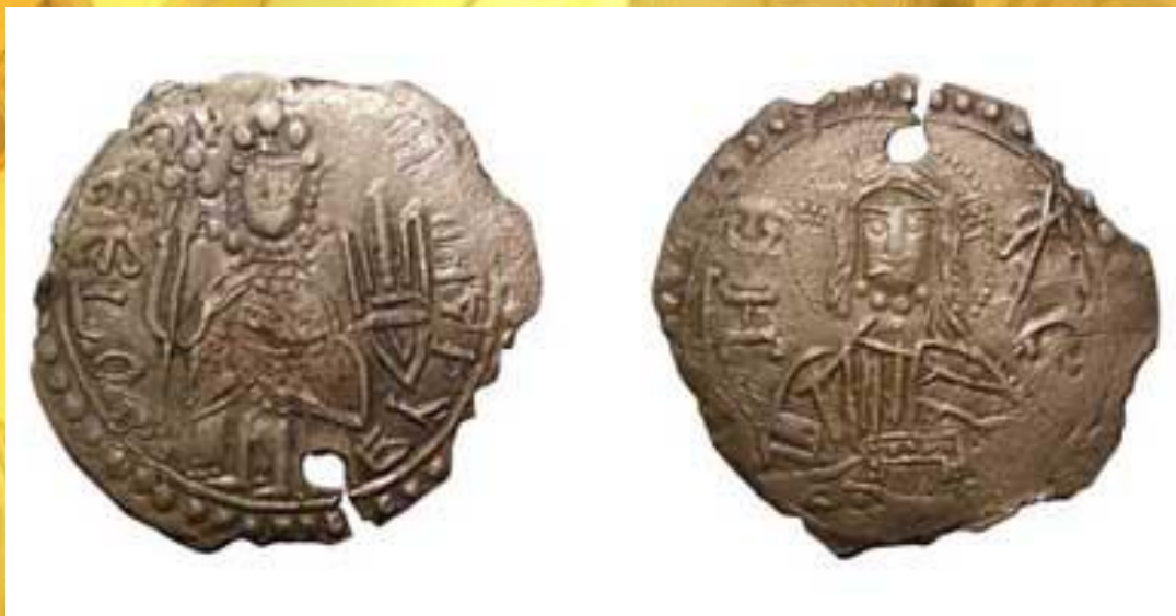
Монета Киевской Руси