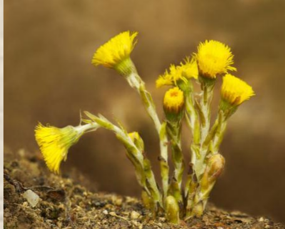
Мать и мачеха