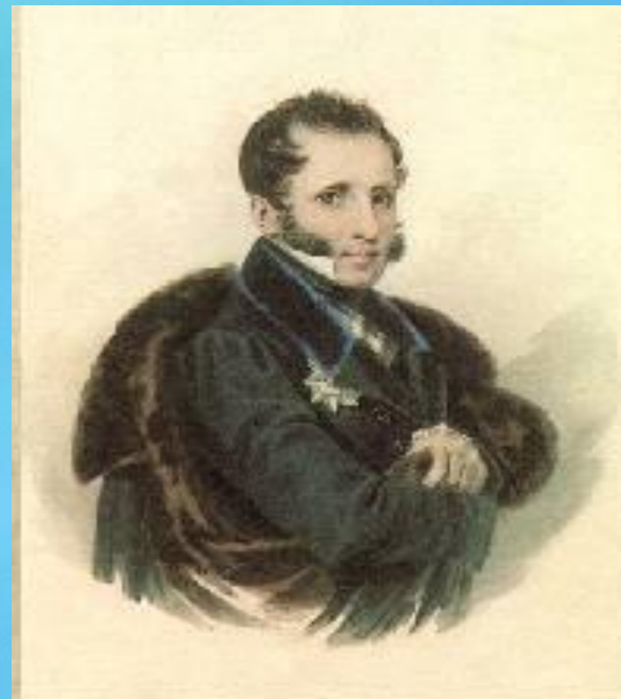
Портрет Уварова С.С.