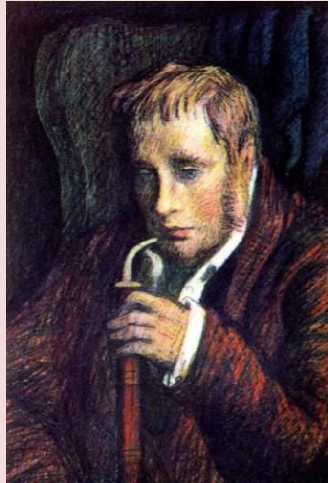
Ю. С. Гершкович. Обломов.