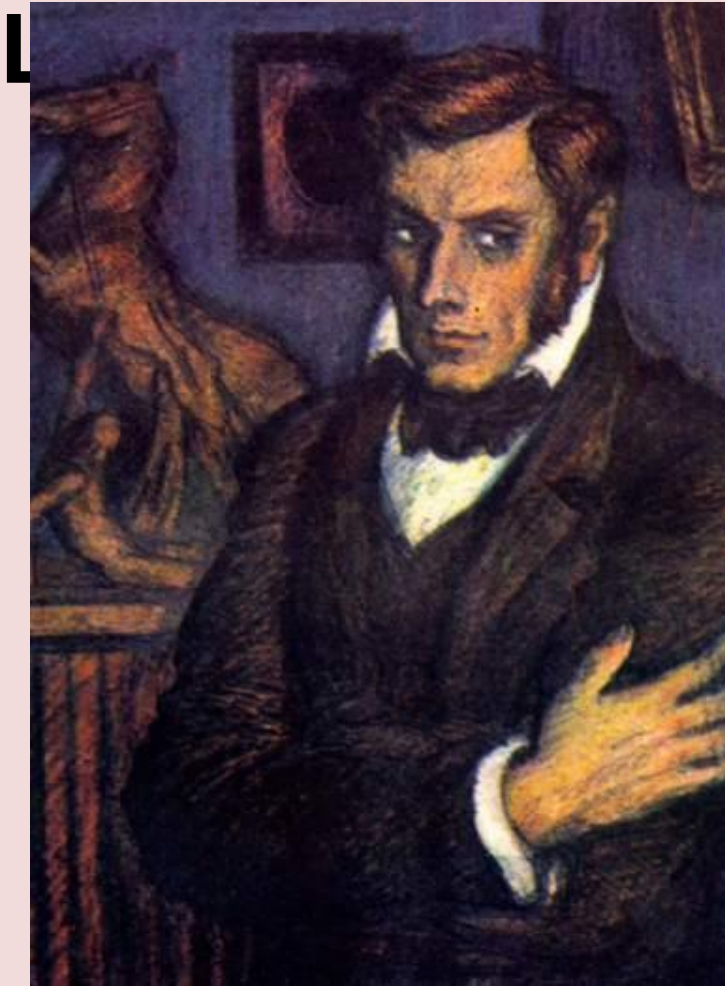
Ю. С. Гершкович. Штольц